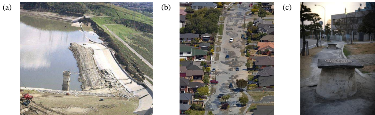
Figure 1. Effets de la liquéfaction lors des séismes de : (a) San Fernando (USA, 1971), (b) Christchurch (Nouvelle-Zélande, 2011), (c) Tohoku (Japon, 2011).

L'objectif du projet Isolate est donc d'améliorer la caractérisation du potentiel de liquéfaction des sols naturels et leurs modélisations physiques et numériques en vue de vérifier le comportement des géo-structures réelles et de réduire le risque de liquéfaction (mitigation) en conformité avec la réévaluation de l'aléa sismique.