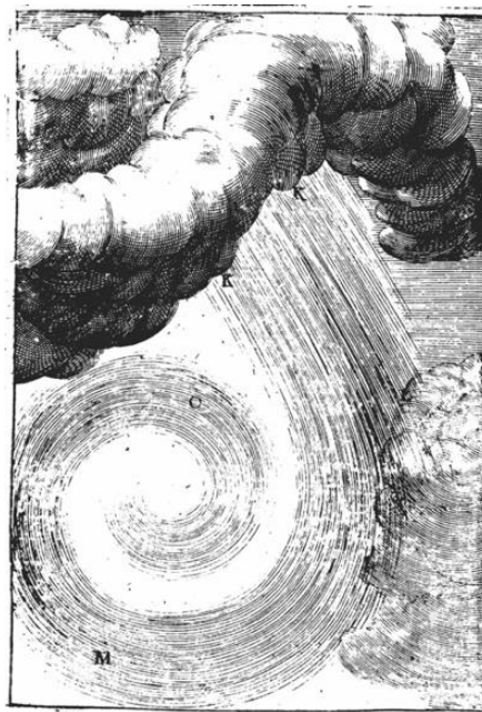
Planche 3 : Tourbillons et tornades générés par un flux d'air contrarié par un obstacle, vent latéral ou région plus dense de l'air, selon Ralph Bohun 13

La prévision du temps constitue l'enjeu fédérateur du développement des baromètres. Plusieurs cyclones tropicaux sont responsables, dans les années 1660, de dégâts importants sur la flotte de guerre anglaise en Mer des Caraïbes et les plantations dans les colonies britanniques de l'est américain, causant de lourdes pertes humaines et financières 11 . Ralph Bohun, un membre de la Royal Society , s'inspirant des expérimentations récentes de son collègue Robert Hooke, est en 1671 l'un des premiers à suggérer d'utiliser le baromètre pour prévoir les ouragans 12 . Fin 1677, plusieurs baromètres sont envoyés aux Barbades dans le but de tester leurs capacités prédictives.