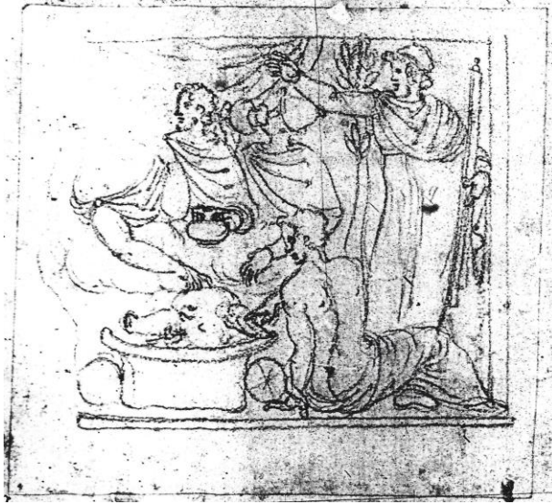
Fig. 3 : Ercole Setti, Etude d'un bas-relief antique avec une scène de banquet , vers 1565, dessin à la sanguine (BAV, Vat. Lat. 3439, f° 105 v°).