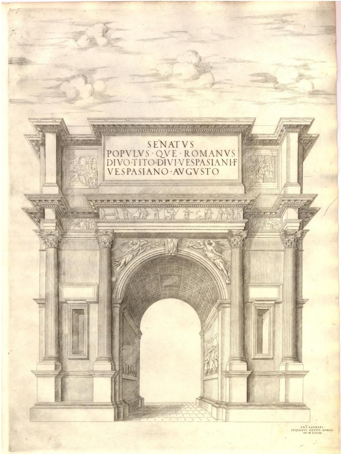
Fig. 6 : Anonyme, L'Arc de Titus , 1548, burin, 500x384 mm (Rome, Lafréry éd.).