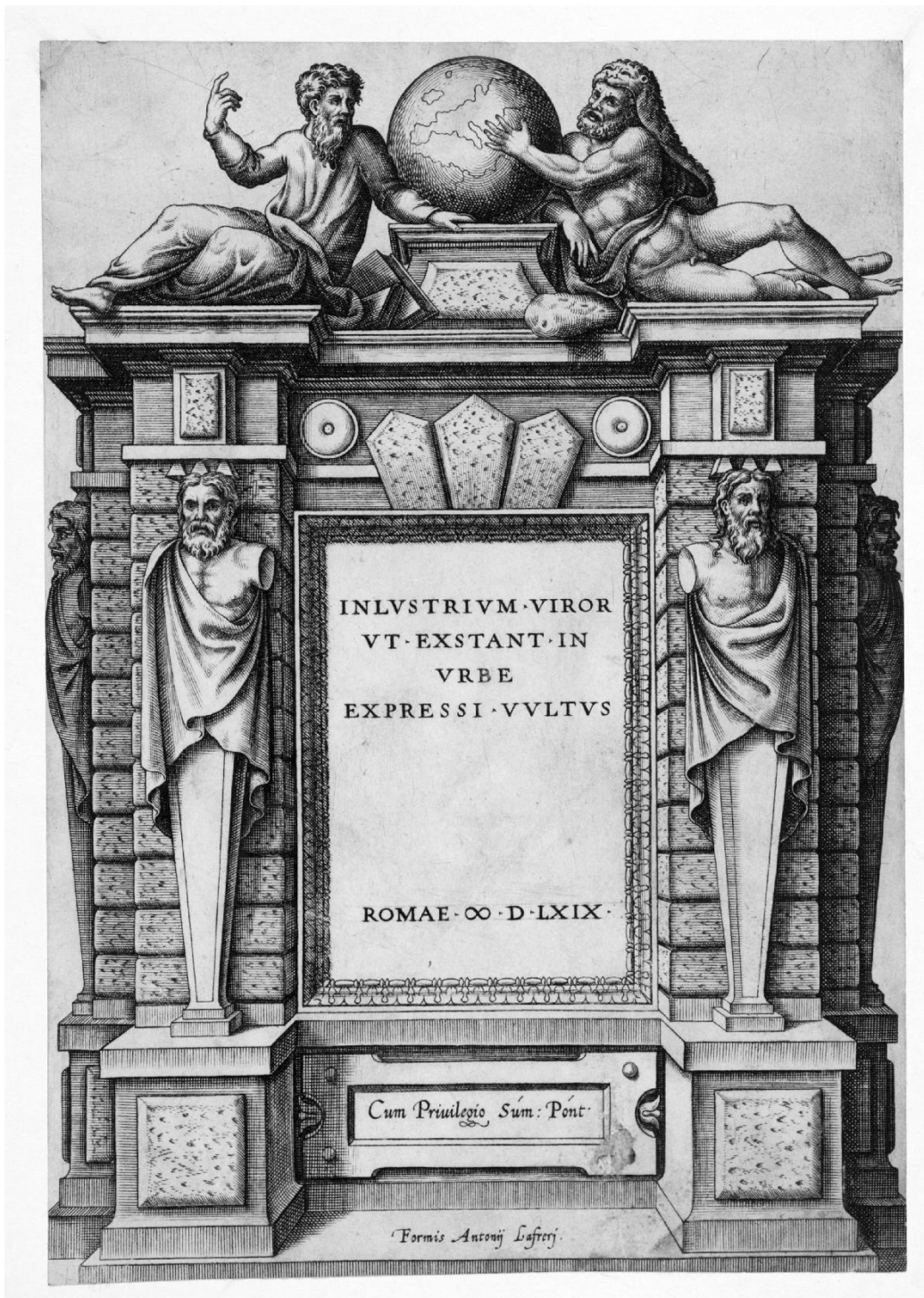
Fig. 11 : Jacob Bos (ici attribué à), Frontispice du recueil de portraits d'hommes illustres d'Achille Staius (Inlustrium virorum ut exstant in Urbe expressi vultus), 1569, burin, 245x165 mm (Rome, Lafréry éd.)