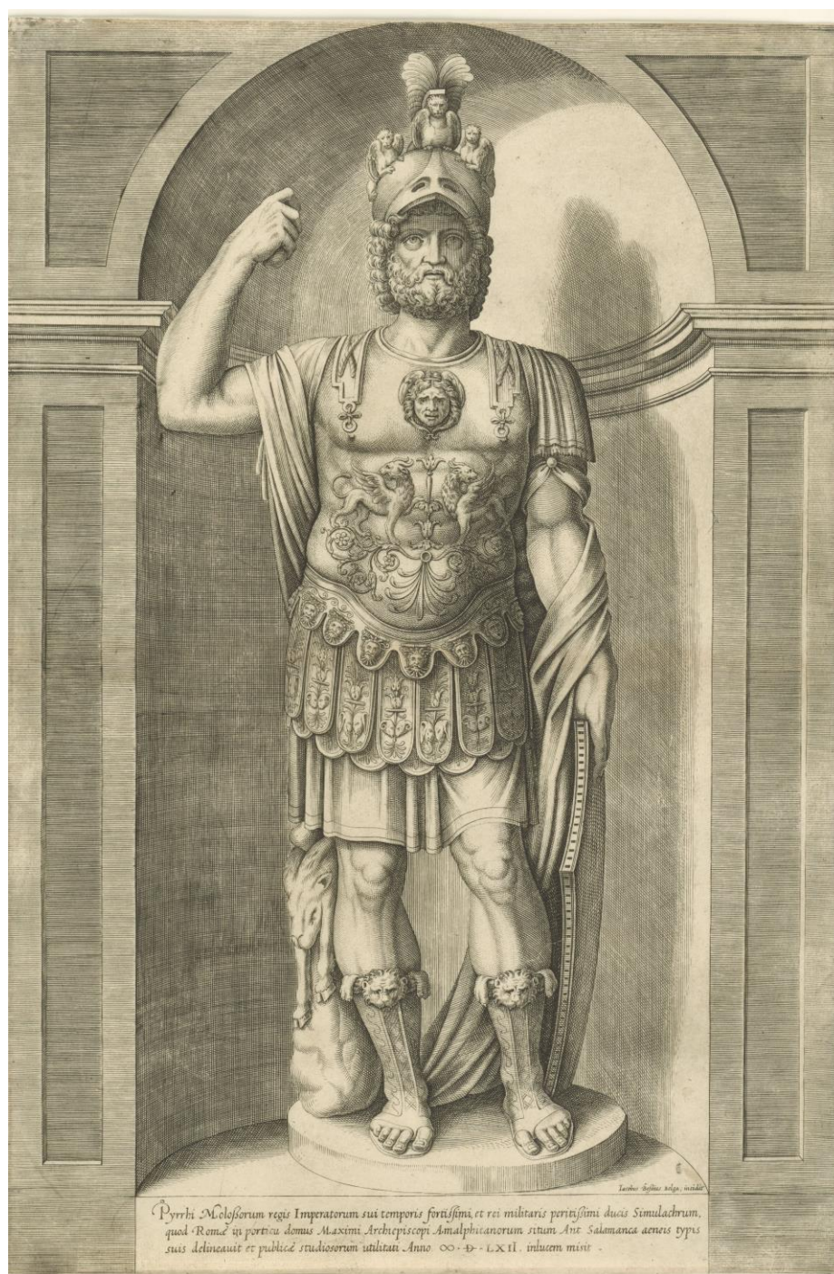
Fig. 8 : Jacob Bos, La statue de Mars-Pyrrhus , 1562, burin, 463x304 mm (Rome, Salamanca éd.).