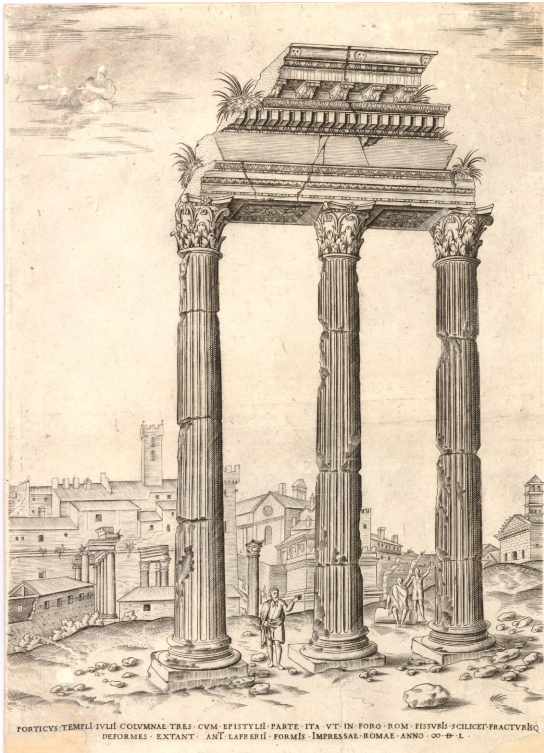
Fig. 10 : Jacob Bos (ici attribué à), Vue du Temple des Dioscures sur le Forum romain , 1550, burin, 293x211 mm (Rome, Lafréry éd.).