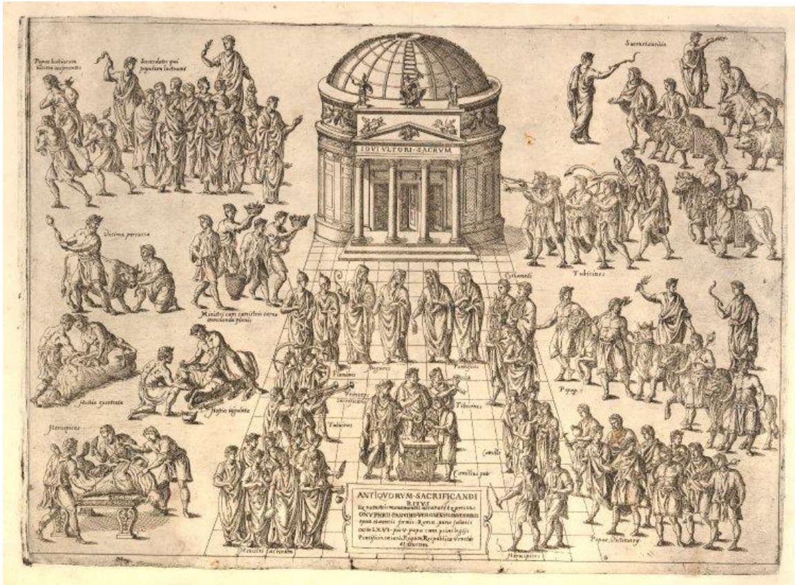
Fig. 1 : Etienne Dupérac et Onofrio Panvinio, Description des rites de sacrifice chez les Romains , 1566, eau-forte, 330x460 mm ( De ludis circensibus libri II , Venise, 1600, pl. Y).

BAV : Vatican, Bibliothèque Apostolique Vaticane