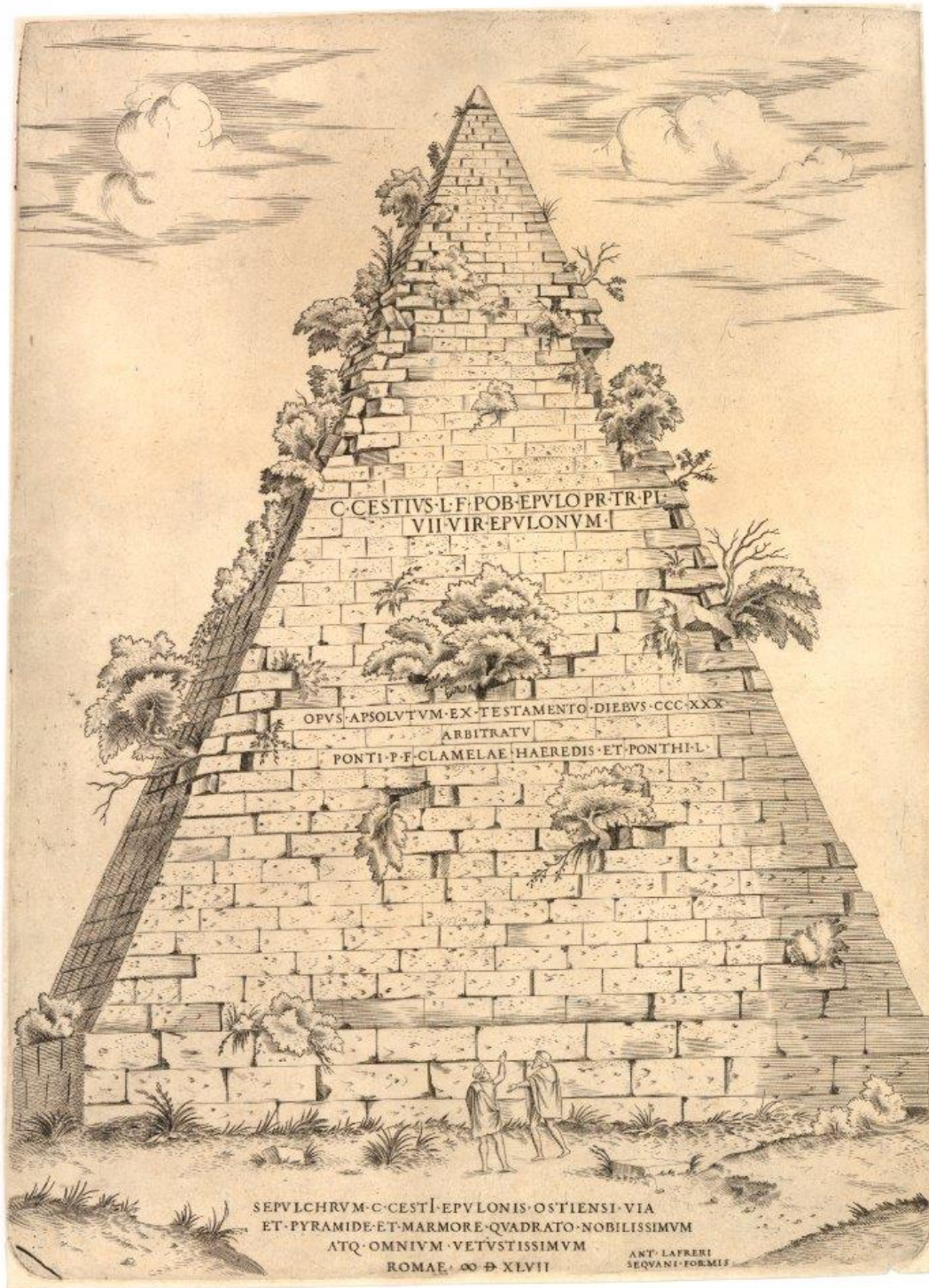
Fig. 9 : Jacob Bos (ici attribué à), Vue de la Pyramide de Cestius , 1547, burin, 393x288 mm (Rome, Lafréry éd.).