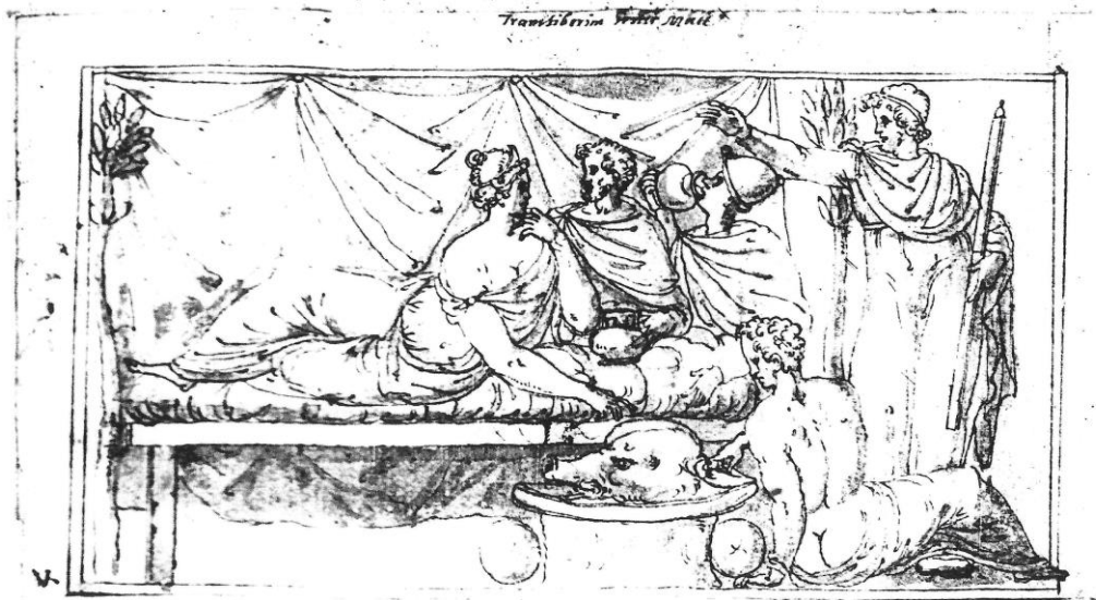
Fig. 4 : Ercole Setti, Scène de banquet antique : restitution et mise au net d'une étude de bas-relief pour Onofrio Panvinio , plume et encre brune, lavis brun (BAV, Vat. Lat. 3439, f° 108 r°).