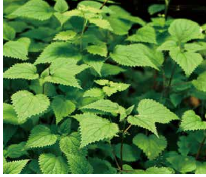
①イラクサ。