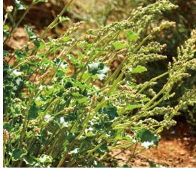
②中華山蓼。