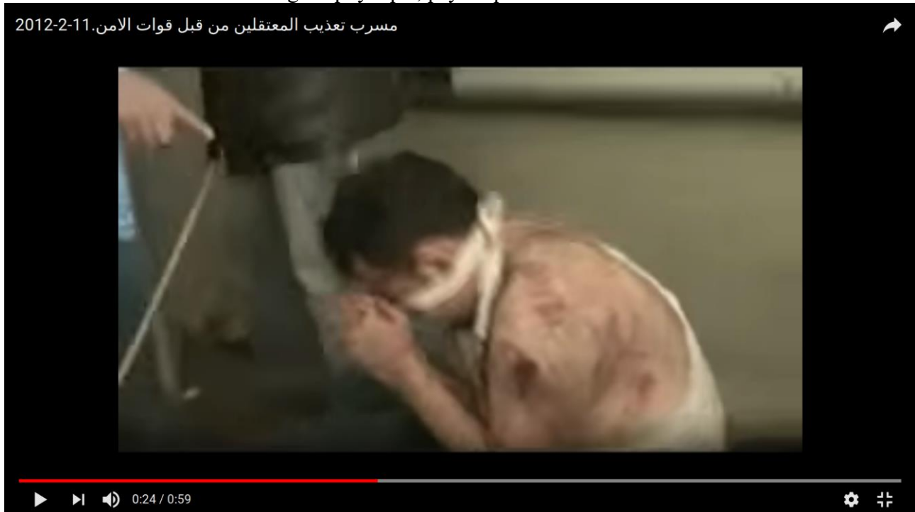
Ill. 2 Capture d'écran « Vidéo fuitée. Torture des détenus par les forces de sécurité », YouTube , 2012.

s'impatisier : « Amenez-le-moi ! ». Le premier insiste, « non, je veux lui montrer comment je réalise un miracle ! ». L'enregistrement s'arrête. Ici, on perçoit l'effet de groupe sur la montée en intensité de la violence, renforcée par la présence de la caméra. Il y a ceux qui voient, qui filment et qui montrent, et celui à qui on a ôté la vue, jeté en pâture à d'autres regards. Avec cette vidéo, on comprend aussi que plus fondamentalement, filmer procède de la logique même de l'acte de cruauté, dans le sens où c'est aussi une manière de s'appropriier le corps de l'autre, de maximiser l'humiliation en s'octroyant le droit de la montrer, de la rejouer et réaffirmer, à chaque fois, la toute-puissance du bourreau. Pour la victime, c'est une forme de mise à mort sociale et symbolique, qui prolonge et démultiplie l'indignité. Filmer fait partie à part entière du dispositif de déshumanisation, en participant à ce processus de négation de l'autre, de l'anéantissement de son intégrité physique, psychique et sociale.