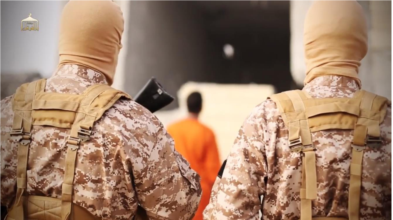
Ill. 6 Healing the believers' chests, al-Furqan Media, 2015