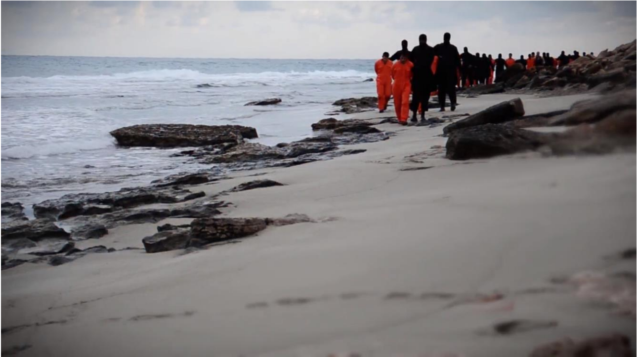
III. 4 Capture d'écran « A message signed with blood to the nation of the cross », al-Hayat Media Center , 2015