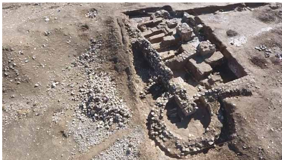
تصویر ۳- بقایای معماری نمایان شده از ترانشه های فصل دوم کاوش در محوطه تل قلعه سیف آباد