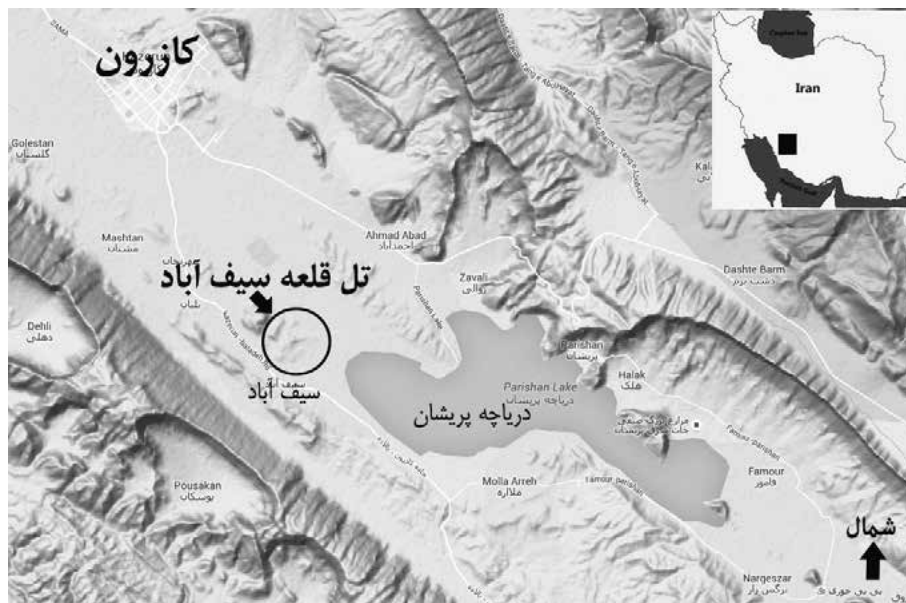
تصویر ۱- موقعیت محوطه تل قلعه سیف آباد در نقشه ایران