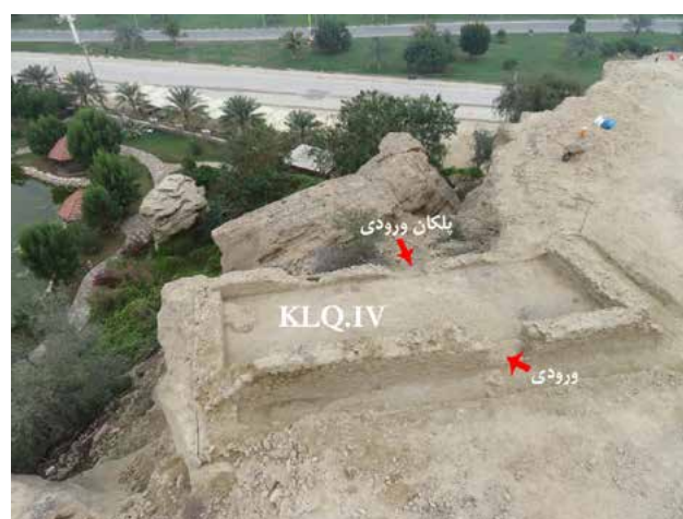
تصویر ۵- موقعیت ترانشه KLQ.IV، و ساختار معماری و ورودی‌های نمایان شده بعد از کاوش