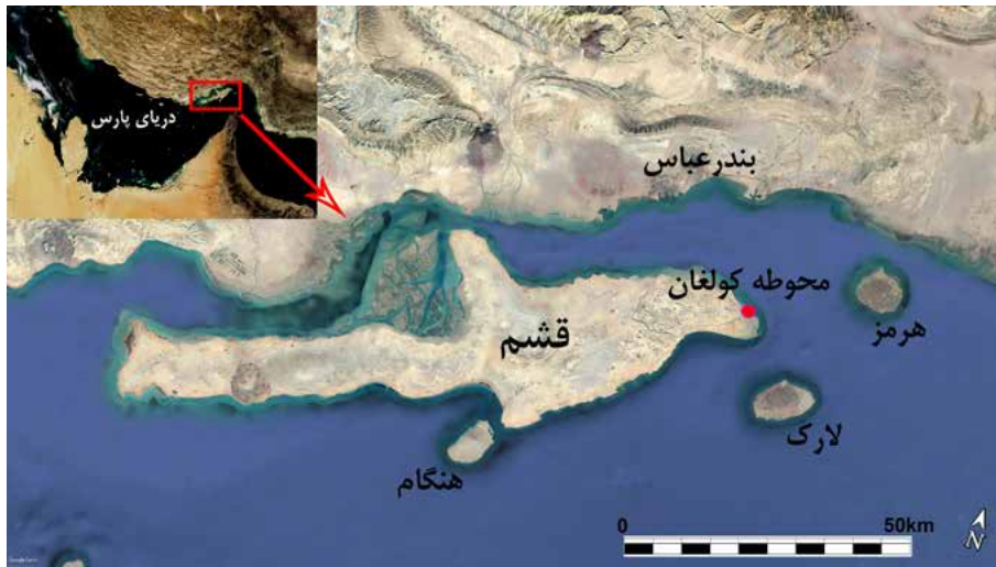
تصویر ۱- موقعیت محوطه کولغان در جزیره قشم و حوزه خلیج فارس

لباف خانیکی، رجبعلی، ۱۳۶۰، بررسی های باستان شناسی جزیره قشم، تهران: پژوهشکده باستان شناسی (منتشر نشده).