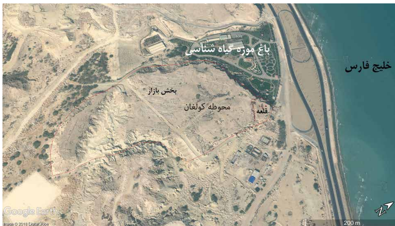
تصویر ۲- عکس هوایی از سطح محوطه کولغان و موقعیت بخش های مختلف