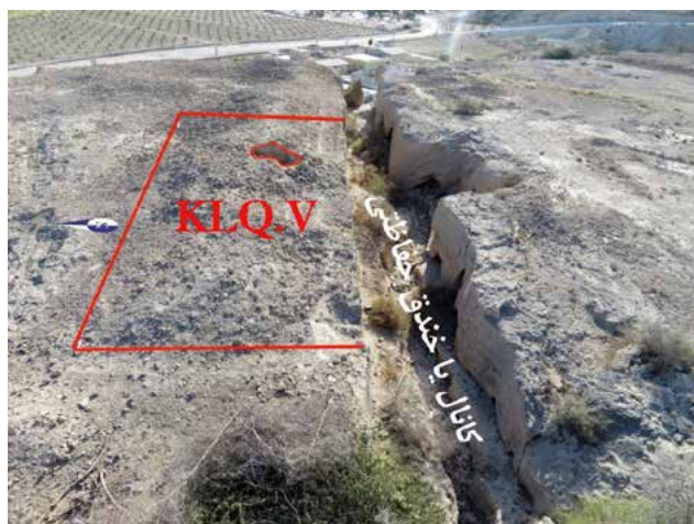
تصویر ۶- موقعیت ترانشه KLQ.V در شمال کانال یا خندق حفاظتی، قبل از کاوش