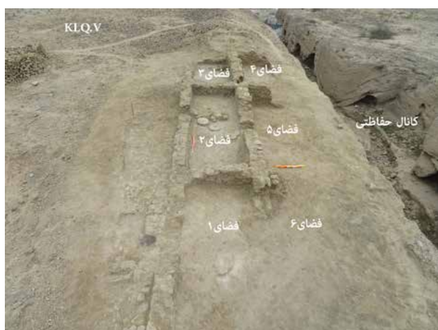
تصویر ۷- بقایای معماری و فضاهای مسکونی و کارگاهی نمایان شده از کاوش ترانشه KLQ.V