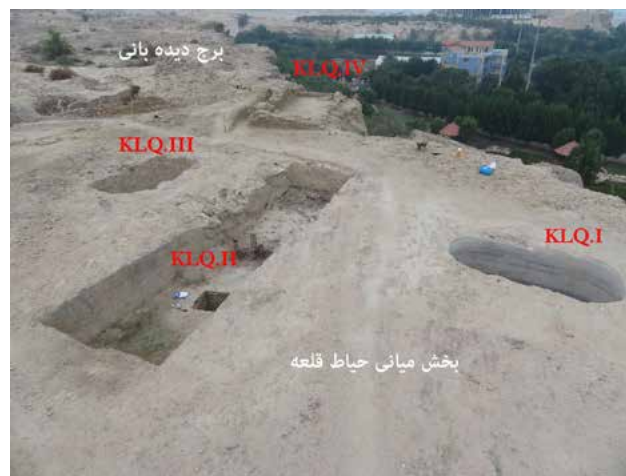
تصویر ۴- موقعیت و وضعیت ترانشه‌ها بعد از کاوش