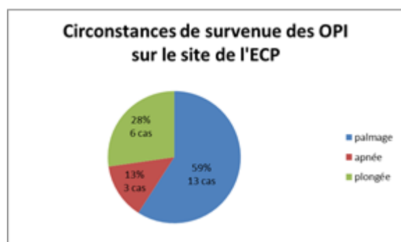
Figure 2. Ce graphique met en évidence les circonstances dans lesquelles survient un OPI. Les exercices de palmes représentent la majorité des cas sur l'ECP.

Certains exercices ont été arrêtés prématurément à cause de la survenue de l'OPI.