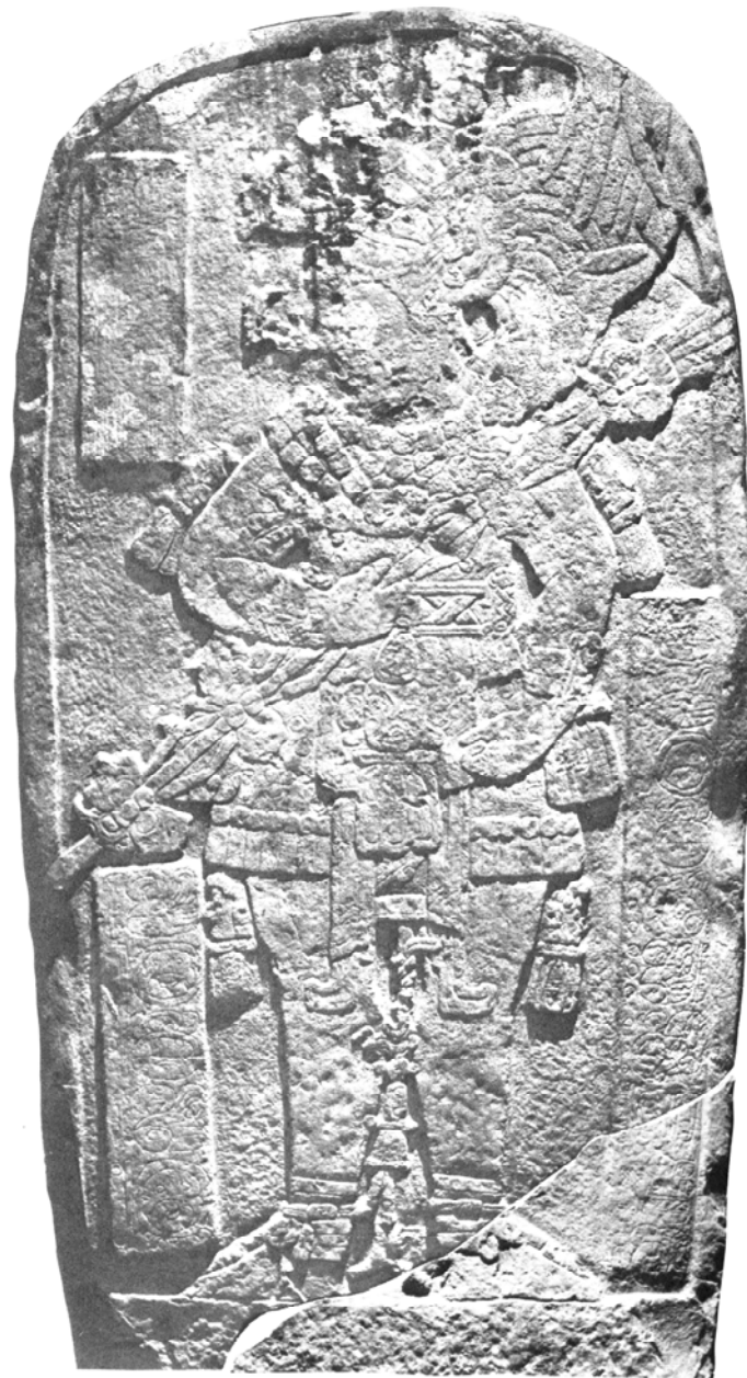
Face antérieure/méridionale, d'après Ian GRAHAM (1978: 2:97(a))