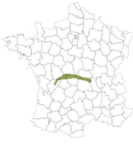
Carte 1. Le Croissant linguistique en France [auteur : Guylaine Brun-Trigaud]

s'étend sur environ 300 km d'est en ouest et atteint 40 km d'épaisseur (du nord au sud) en son centre (du nord de la Creuse au sud de l'Indre). Il est cependant beaucoup plus mince en Charente (pas plus de 5 à 10 km de large).