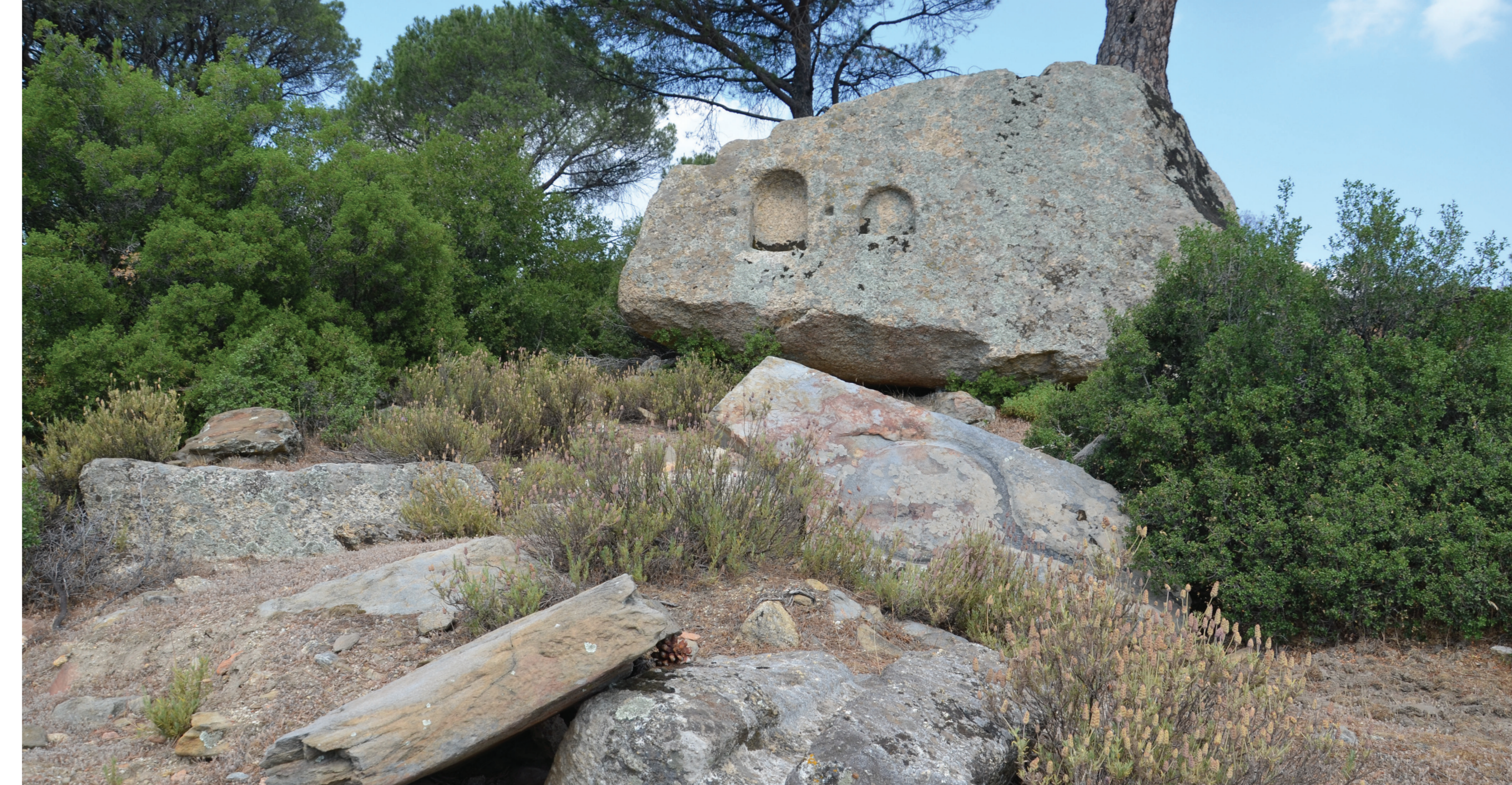
Huilerie hellénistique à Sarnic Mevkii.

Les données que nous avons à traiter sont d'ordre archéologique. Il s'agit principalement de vestiges issus de la culture matérielle (céramique, textes épigraphiques, aménagements de production, tombes, bâti), d'ensembles architecturaux (fermes, fortification) ou encore d'occupation du territoire (terroir, communautés). Ces données sont collectées par un travail de terrain impliquant une prospection orale auprès des populations modernes habitant les lieux, une prospection pédestre dans les campagnes environnantes, une prospection aérienne (satellite ou par drone) sur des zones difficiles d'accès. Une fois repérées, les vestiges sont documentés (relevé à l'échelle, photographie, modélisation 3D) puis intégrés à une base de données. Celle-ci est ensuite spatialisée grâce à la mise en place d'un SIG.