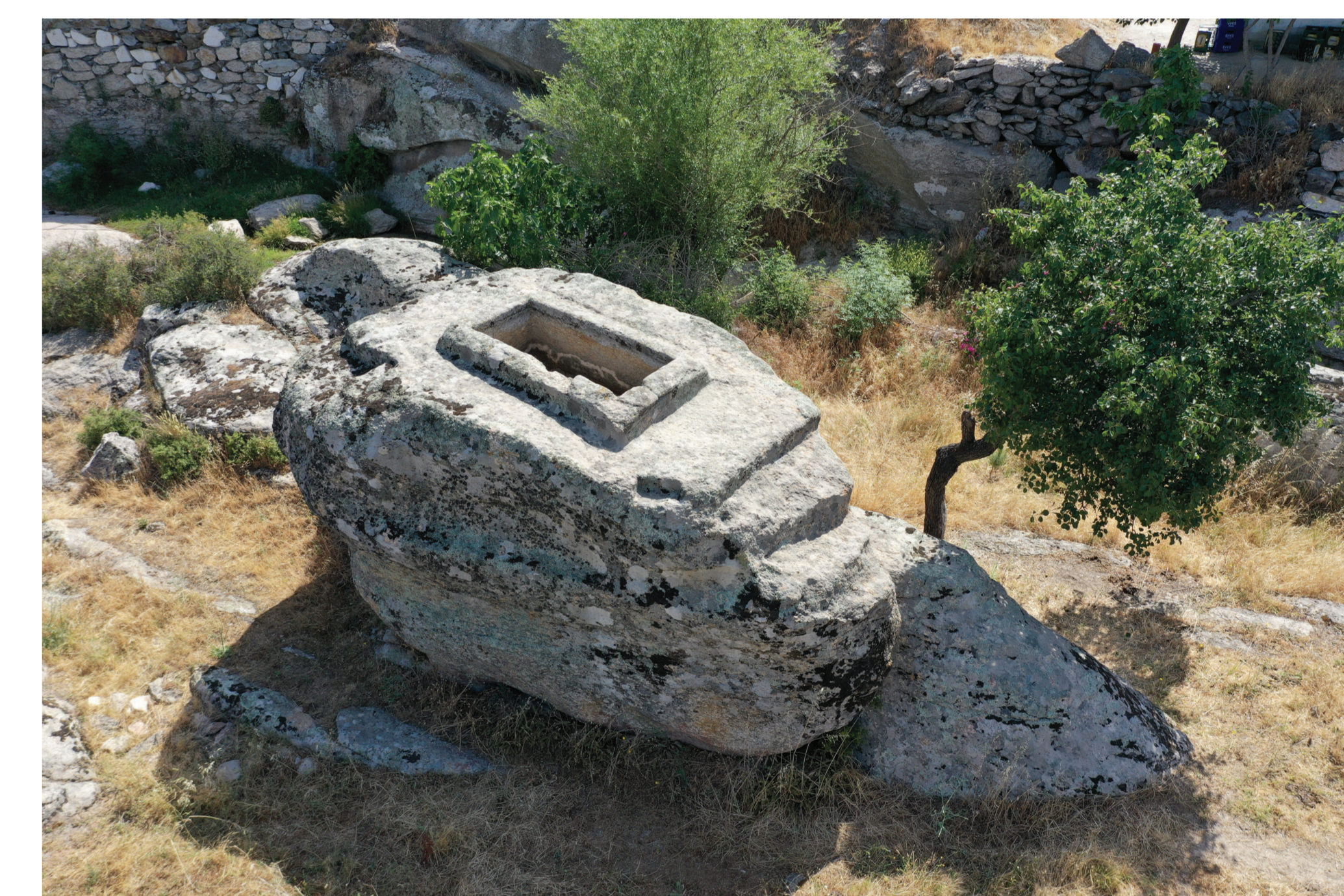
Sarcophage rupestre à Haciimamlar.