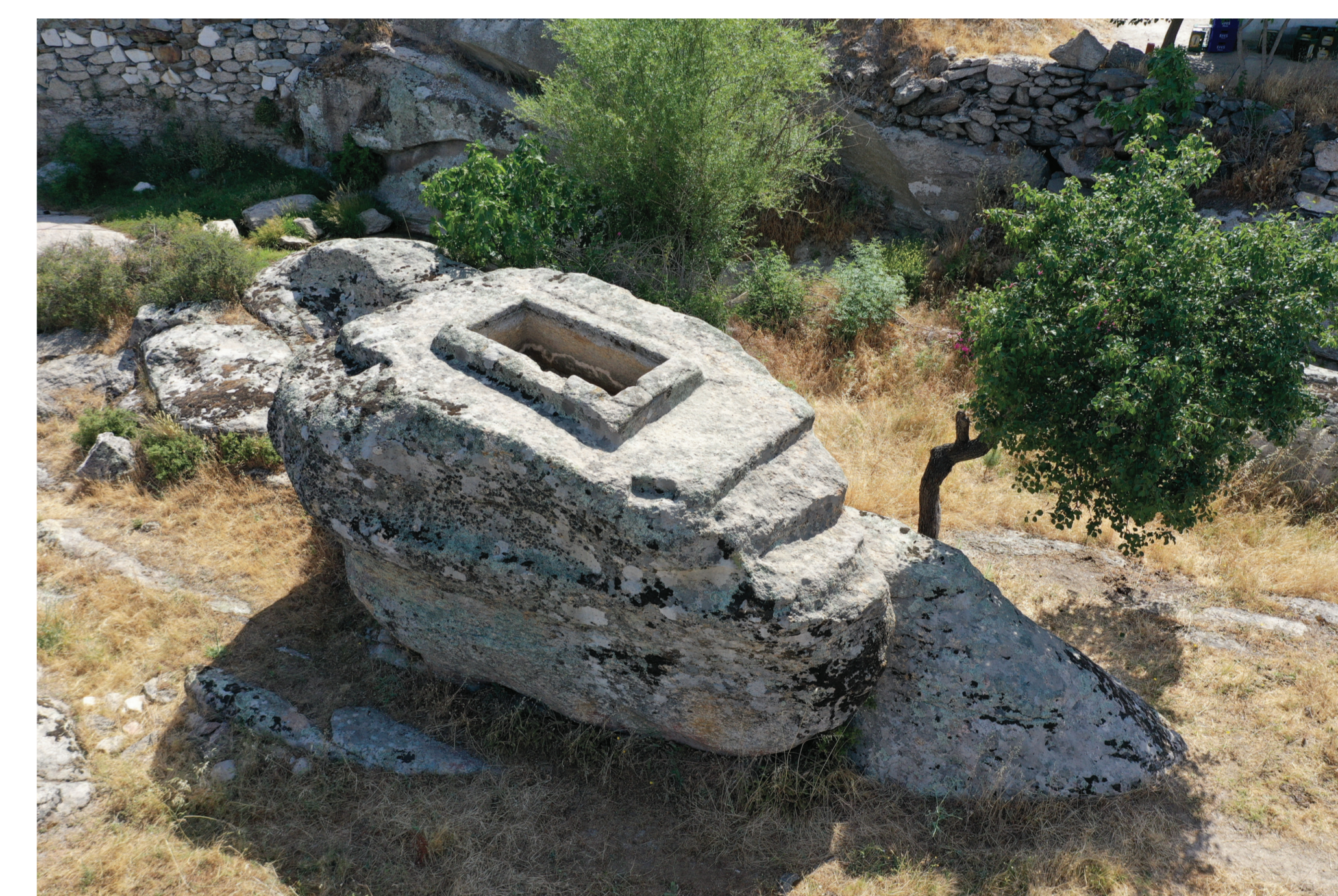
Sarcophage rupestre à Hacıimamlar.