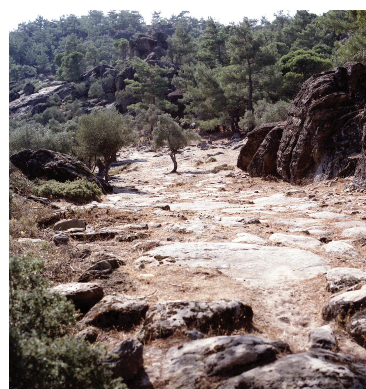
Vue de la voie antique de Mylasa à Labraunda en 1960, localisation inconnue (photo : archives de Labraunda).

C'est la raison pour laquelle nous croisons l' ensemble des sources archéologiques disponibles (céramique, architecture, numismatique, épigraphie, etc.) afin de disposer du plus d'indices possibles. Cette démarche nécessite la mise en place d'une équipe pluridisciplinaire dont chaque spécialiste, à travers ses analyses, permettra de contribuer à l'identification de l'image finale.