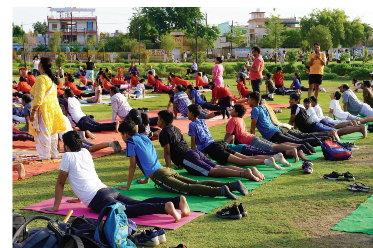
Le yoga en Inde : d'une pratique spirituelle réservée aux ascètes (Sadhus)... à une pratique grand public visant la santé (International Yoga Day).