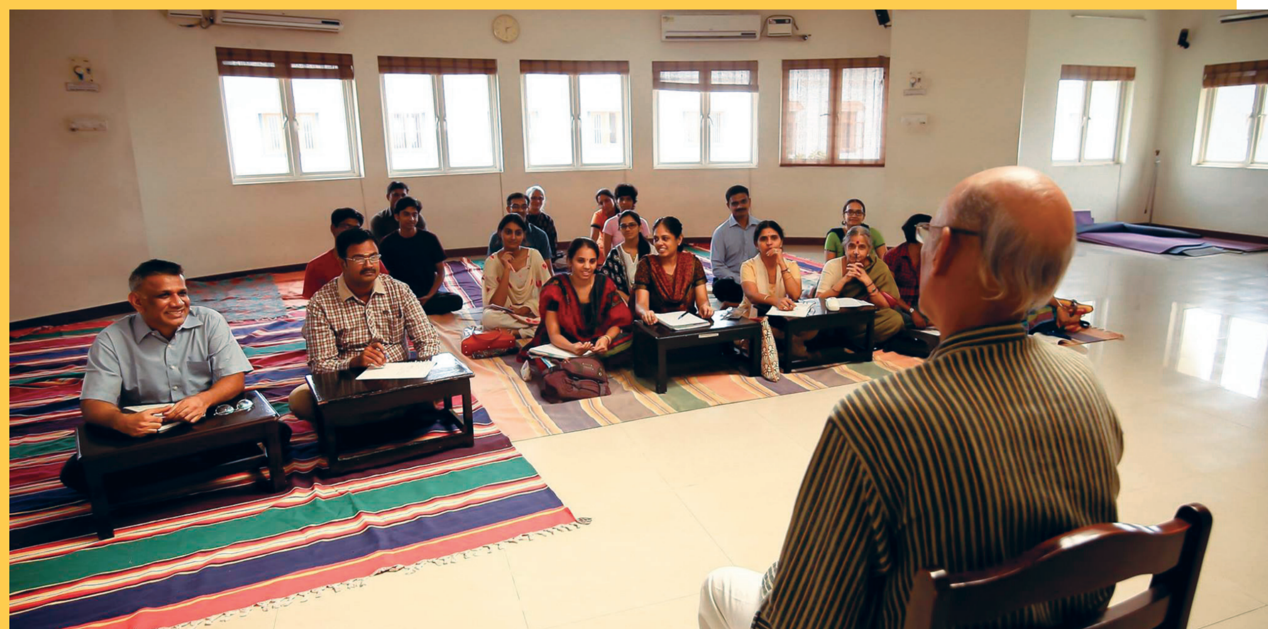
Workshop d'enseignement du yoga, centre KYM, Chennai, Inde (photo : www.kym.org).

80 % des pratiquants français sont des femmes (source : INJEP, 2020)