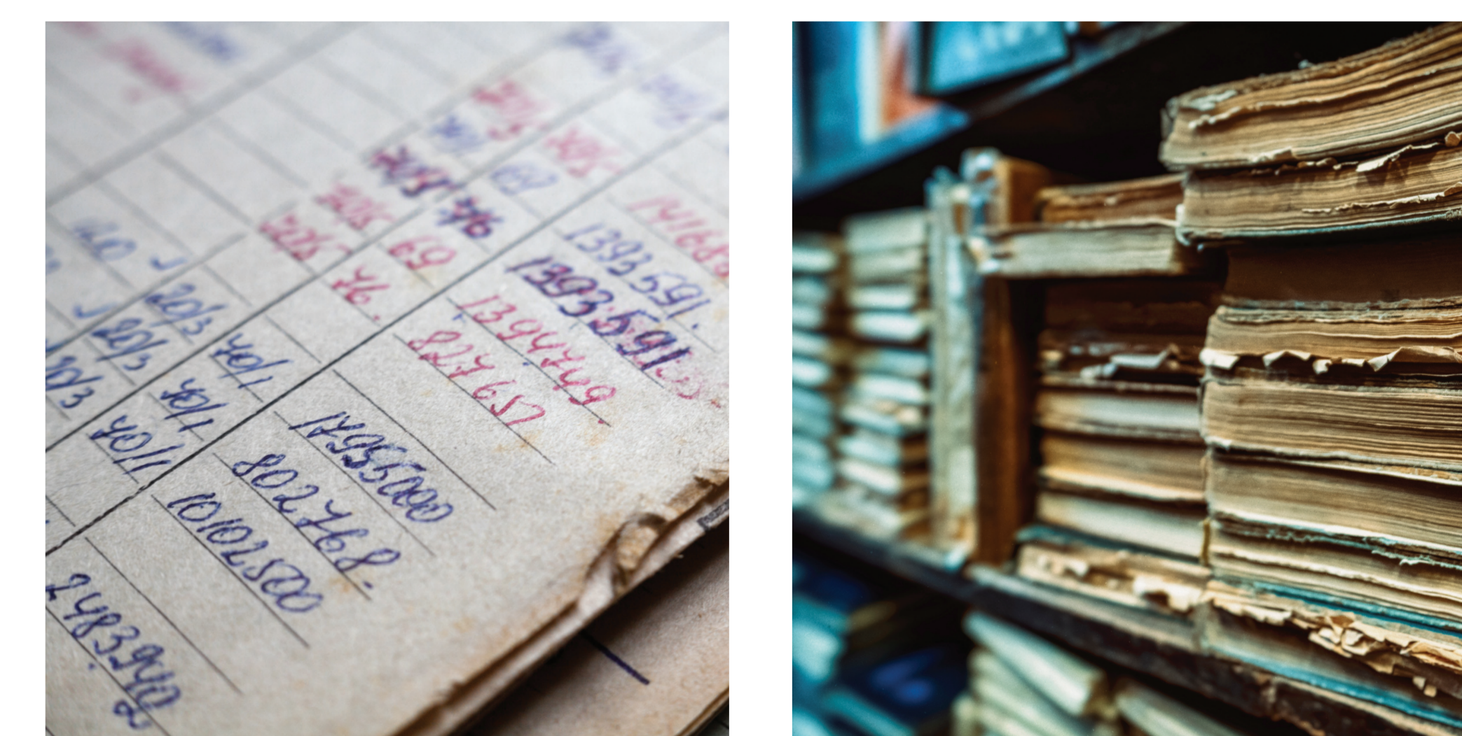
Types de sources étudiées dans le cadre d'un tel projet de recherche : archives administratives.

À ce stade, nous retenons une définition large et inclusive, en considérant l'ensemble des femmes qui dirigent une entreprise qui leur appartient en tout ou partie. Identifier les femmes entrepreneures nécessite de ne pas se limiter à une vision « schumpéterienne », de l'entrepreneur conquérant, innovant, dont les motivations seraient centrées sur la maximisation du profit. L'entrepreneur.e peut être porté.e par un ensemble de motivations et de valeurs de transmission qui ne se limitent pas à un horizon strictement économique.