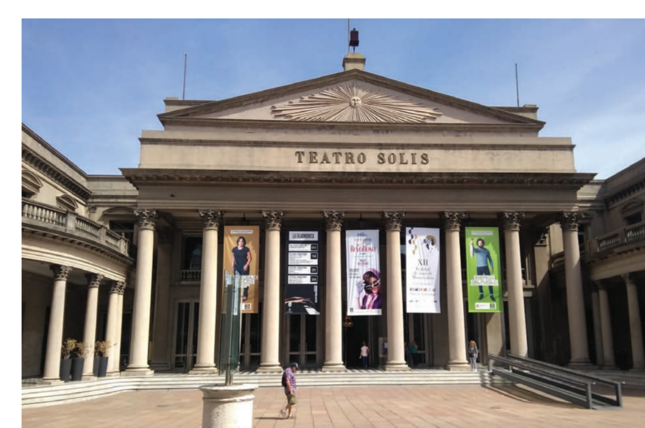
Le Teatro Solis aujourd'hui, à Montevideo (Uruguay). Les archives du théâtre ont apporté un important corpus de documents (programmes, etc.) pour le projet SOFTPOWARTS.

Les membres du consortium ont d'abord regroupé et organisé les corpus de sources en leur possession. Ils ont ensuite annoté, produit et croisé les données. En effet, à l'instar des méthodes de la micro-histoire italienne, ce projet s'intéresse à l'action humaine dotée de sens, de l'intentionnalité, à la justification des acteurs et médiateurs, et s'attache aux logiques individuelles qui s'insinuent à l'intérieur même des structures. L'histoire globale, à la lumière des subalternistes, se donne pour propos le tableau des similitudes, des connexions et de divergences entre les sociétés un peu à l'écart du « récit universel » européen. Ces deux courants historiques guident les réflexions et contribuent à une décentralisation historique.