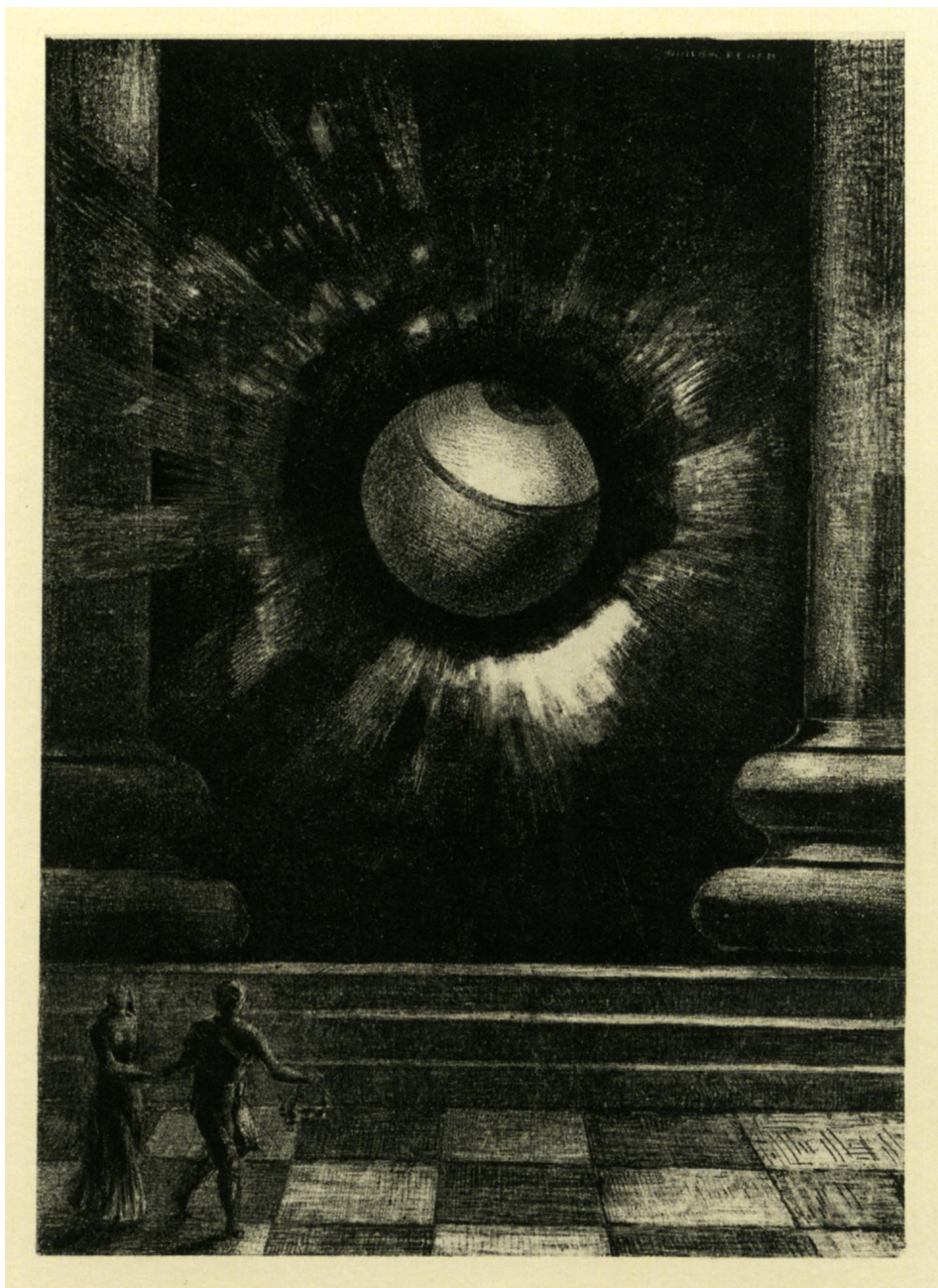
“Vision”, planche VIII, in : Dans le rêve, Lithographie, 1879