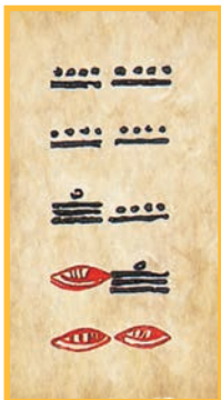
Codex de Dresde, Les éléments correctifs du tableau de la page 24.

A=9.9.16;0.0. est le 72 e multiple de la durée 18 980 (52 haab ou 73 tzolkin ) dont les multiples conservent les dates CR. Pour continuer la lecture, il faut puiser un correctif dans le tableau de la page 24, et obtenir des mayanistes une lecture des dates atteintes. Ce travail fructueux entre mathématiciens et mayanistes permet de donner lieu à des conjectures historiques intéressantes, que des recherches supplémentaires permettront de confronter, de confirmer ou d'invalider.