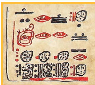
Codex de Dresde, trois dates en bas de la page 24.