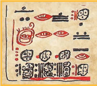
Codex de Dresde, trois dates en bas de la page 24.