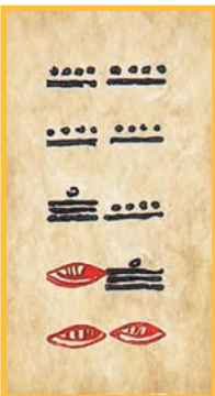
Codex de Dresde, Les éléments correctifs du tableau de la page 24.

A=9.9.16;0.0. est le 72 e multiple de la durée 18 980 (52 haab ou 73 tzolkin ) dont les multiples conservent les dates CR. Pour continuer la lecture, il faut puiser un correctif dans le tableau de la page 24, et obtenir des mayanistes une lecture des dates atteintes. Ce travail fructueux entre mathématiciens et mayanistes permet de donner lieu à des conjectures historiques intéressantes, que des recherches supplémentaires permettront de confronter, de confirmer ou d'invalider.