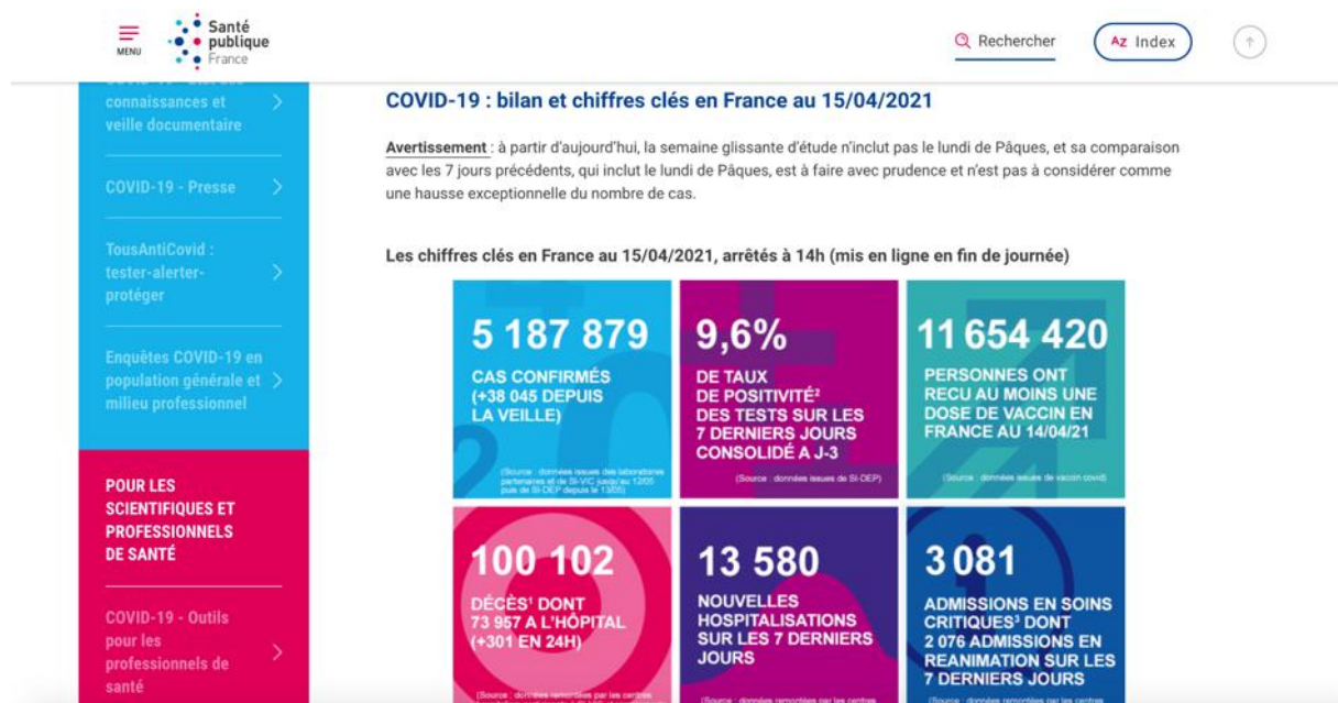
Fig. 4 : Capture d'écran du site de Santé Publique France le 15 avril 2021. Source https://www.santepubliquefrance.fr/dossiers/coronavirus-covid-19/coronavirus-chiffres-cles-et-evolution-de-la-covid-19-en-france-et-dans-le-monde