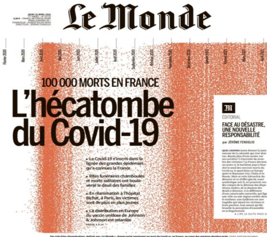
Fig. 3 : Une du Monde daté du 15 avril 2021.

Pour le comprendre, nous utiliserons un nouveau type de données. Parallèlement à la Une, Le Monde ouvrit un chat sur son site permettant à ses lecteurs de commenter cet événement en direct. En effet, Le Monde , une autorité quasiment institutionnelle dans le paysage de la presse française (Chatelain 1962), s'est doté en 2009 d'un service de vérificateurs de faits ( fact checkers ) (Bigot 2019). Il participait ainsi à un mouvement initié aux Etats-Unis (Graves 2016) et, en France, par le journal Libération . Très vite, ce service a rempli trois fonctions distinctes : vérifier les faits avancés par les acteurs politiques ; établir les faits concernant les nouvelles et les rumeurs circulant sur internet ; répondre aux interrogations exprimées en ligne par les abonnés 19 . Les Décodeurs constituent ainsi à l'intérieur du journal le fer de lance d'une politique générale consistant à établir une relation plus égalitaire et horizontale avec le lectorat, comme ce fut le cas ici. Les lecteurs ont pu intervenir pour commenter ce nombre. Ces interventions publiques nous permettent d'observer comment ils associent un nombre à des émotions.