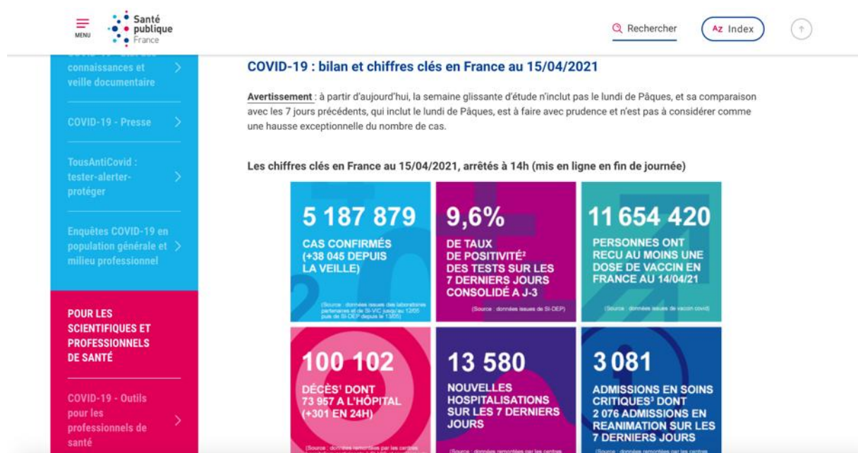
Fig. 4 : Capture d'écran du site de Santé Publique France le 15 avril 2021. Source https://www.santepubliquefrance.fr/dossiers/coronavirus-covid-19/coronavirus-chiffres-cles-et-evolution-de-la-covid-19-en-france-et-dans-le-monde