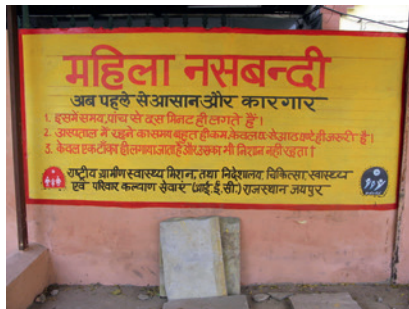
Figure 2. Affiche de sensibilisation à la stérilisation féminine sur l’un des murs de l’hôpital.

Bien qu’actuellement le counseling contraceptif ne s’effectue plus en vue de résultats escomptés par le gouvernement ou de populations ciblées, le travail des médecins semble, aujourd’hui encore, dicté par des considérations paternalistes et un souci de rentabilité. En taisant la diversité des offres contraceptives, en voulant restreindre la marge de pouvoir décisionnel des patientes, le personnel entend agir par souci d’efficacité et de rationalité. Une partie du problème viendrait du fait que les femmes de milieux défavorisés n’opteraient pas pour les méthodes contraceptives « infaillibles » qui