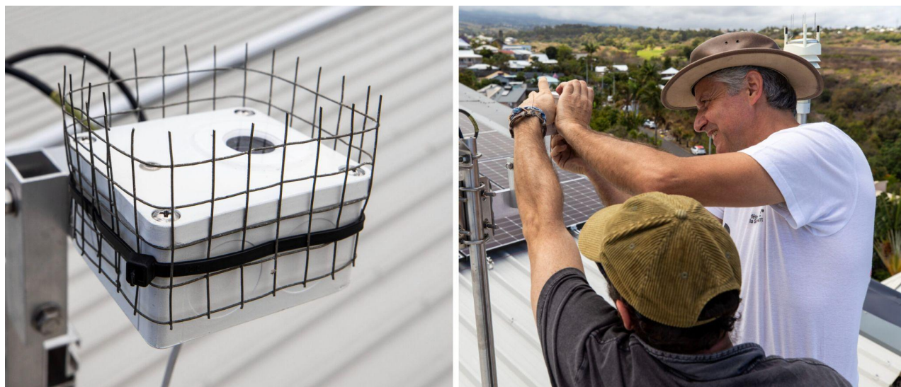
Figure 1. Photographie d'un photomètre TESS-W installé par l'équipe de l'Observatoire de l'environnement nocturne à La Réunion . Le projet MITI-PLUM fera appel au même matériel.