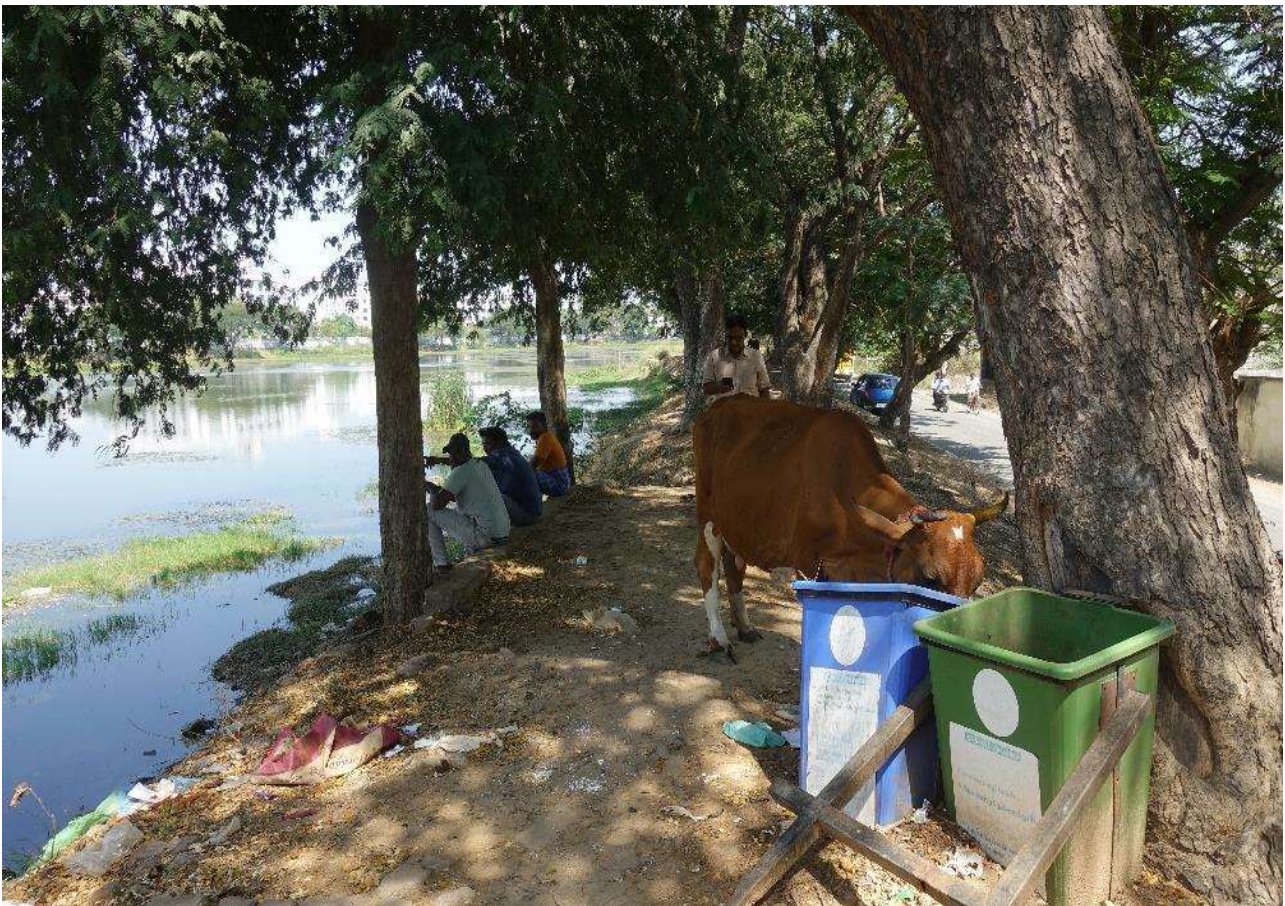
Figure 2. Sur la berge orientale du lac de Kanagan, trois hommes discutent assis face à l'étendue d'eau, un autre déambule en consultant son téléphone, une vache cherche de la nourriture au pied de poubelles détériorées (2023).

Par le passé, Kanagan avait également, au quotidien, d'autres usages que l'irrigation : l'abreuvement des troupeaux, la pêche, la récolte de végétation, la collecte des limons fertilisants. Les populations pauvres des quartiers nord, des Dalits (basses castes autrefois dénommés intouchables) y abreuvaient leurs animaux, y lavaient leur linge, et certains y faisaient leurs besoins. Ces pratiques ont en grande partie disparu. Comme dans le cas de Chennai [Coelho op. cit. ], avec la dynamique d'urbanisation, les riverains pauvres perdent une partie de leurs usages, voire leur logement pour ceux qui s'étaient établis illégalement sur les berges. Des vaches divaguent cependant toujours sur les berges et y broutent ( fig. 2 ). Or, cet élevage n'a rien d'une activité traditionnelle : il est lié au contexte urbain, fondé sur la proximité de la clientèle pour un produit périssable, le lait. Les éleveurs, de la caste (Yadav) spécialisée dans cette activité, ne sont pas installés là depuis des décennies, mais sont arrivés en même temps que les autres habitants, lors du lotissement, vers 1990-1995. On comptait une vingtaine d'élevages laitiers à l'époque, pour quatre en 2020.