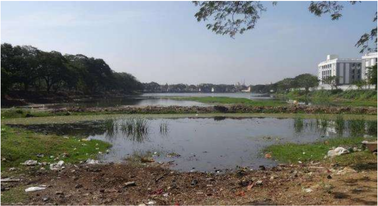
Figure 1. Lac de Kanagan avec ses berges arborées et, à droite, l’hôpital universitaire, construit sur le bassin d’alimentation en eau de la retenue (Pondichéry, 2019).

tamoul, tank , pond , lake ou water body en anglais – traduit leur variété de dimension et de fonction. Aujourd’hui, elles sont de plus en plus menacées par l’urbanisation rapide en cours dans l’ensemble du pays [Zérah et Denis 2021] et par un manque d’entretien. Entre 2000 et 2015, 19 des 147 retenues recensées à Pondichéry ont entièrement disparu 1 . Dans le même temps, nous observons des mobilisations croissantes pour les préserver et les mettre en valeur, comme c’est le cas ailleurs en Inde [Murphy et al. 2019], au Sri Lanka [Hettiarachchi et al. 2019] ou en Europe [Dournel et Sajaloli 2012]. C’est ainsi le cas du lac de Kanagan ( fig. 1 ), que nous traitons dans cet article. Déjà représentée sur une carte de 1714, cette petite retenue (12 ha) jadis en pleine campagne se retrouve aujourd’hui dans l’agglomération de Pondichéry.