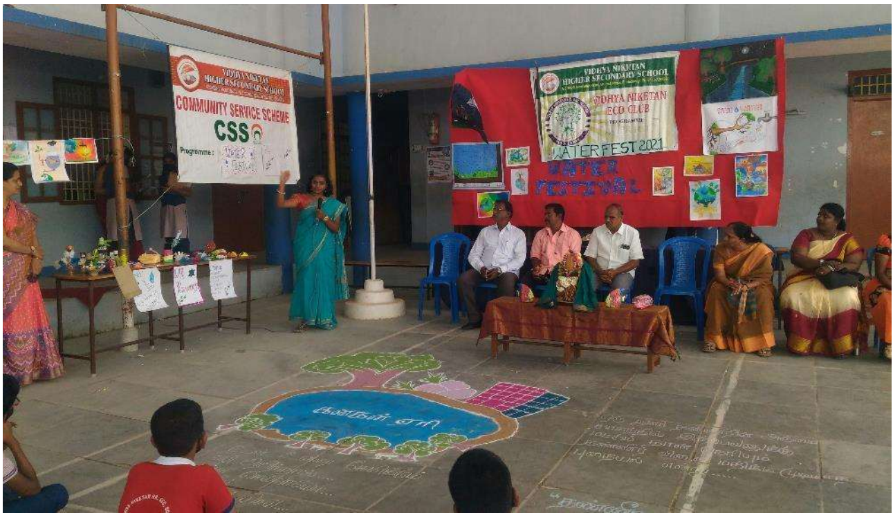
Figure 6. Festival de l'eau dans une cour d'école de Kanagan (2021).

Sur la table, au centre, le neer kudam est paré de fleurs et d'étoffes. Au sol, un kolam illustre un poème sur l'eau du lac et, à gauche, les prix remis aux enfants pour leurs contributions.