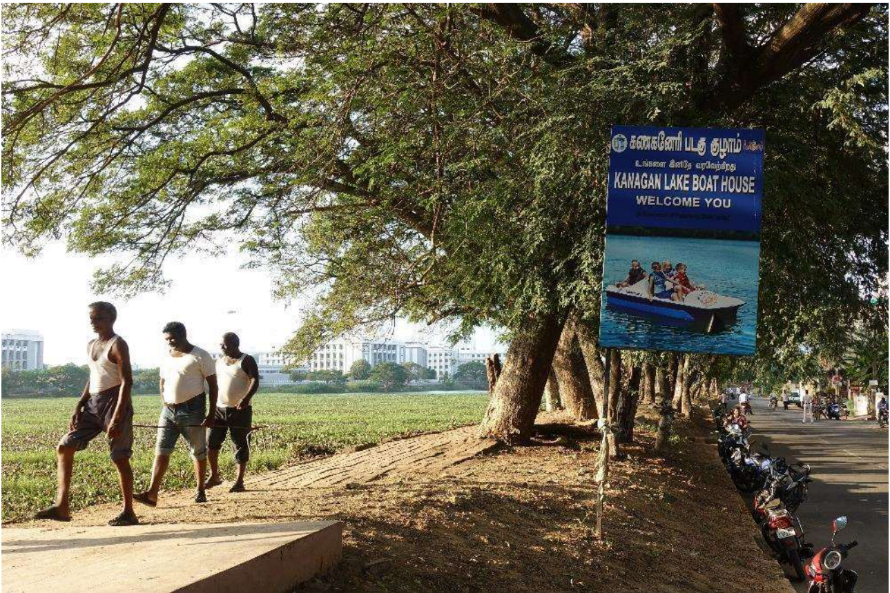
Figure 4. Employés du Département des travaux publics (Public work department), chargés de retirer du lac les jacinthes d'eau, qui l'ont envahi et empêchent notamment tout canotage (2019).