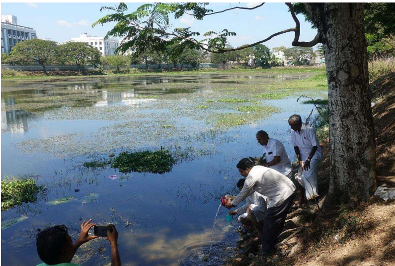
Figure 5. Des membres de Kewa versent une partie de l'eau du neer kudam (provenant des autres retenues d'eau de la région) dans Kanagan et en prélèvent du lac pour la verser dans le pot (2023).

Le Festival de l'eau organisé quasi annuellement par le collectif All for Water for All depuis 2016 est un point d'orgue dans la mise en valeur du lac. A cette occasion, des neer kudam (pots à eau) sont portés de retenues en retenues dans la région de Pondichéry et remplis successivement d'eau de tous les sites inscrits le long des itinéraires. En 2023 à Kanagan, cette cérémonie a eu lieu à plusieurs reprises, conduite par des membres de Kewa (fig. 5) mais également avec des élèves des écoles voisines.