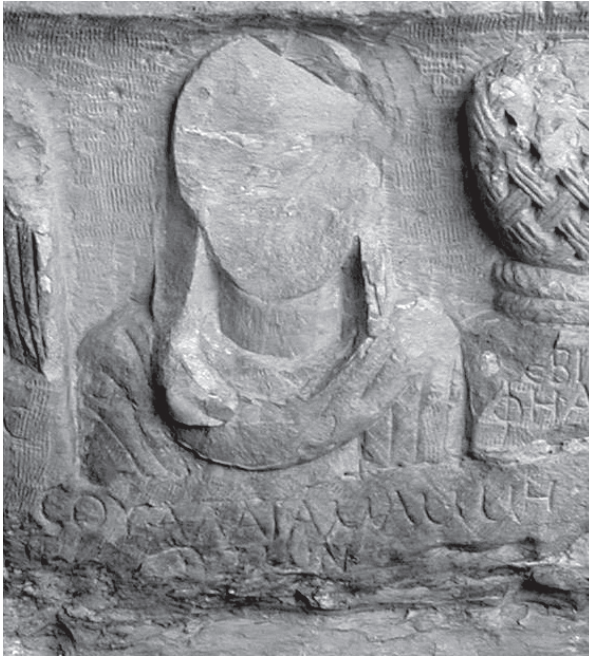
Fig. 4. μῶμη à Zeugma [IGLS I 99] (J.-B. Yon).

Une transcription du même mot serait également attestée dans une inscription de Zeugma.