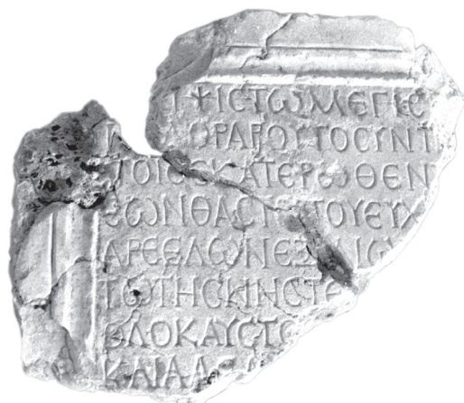
Fig. 2. 'wnt' (?) à Palmyre [SEYRIG, « Nouveaux monuments palmyréniens », p. 275, n° 6] (J.-B. Yon).

Dans le vocabulaire des banquets et de l'organisation religieuse, J. T. Milik a proposé de reconnaître dans deux inscriptions grecques la transcription du mot araméen 'wnt' « service » et donc « équipe sacerdotale » 36 . La première inscription est une dédicace de Palmyre, très lacunaire, dont H. Seyrig avait donné en 1933 une première publication :