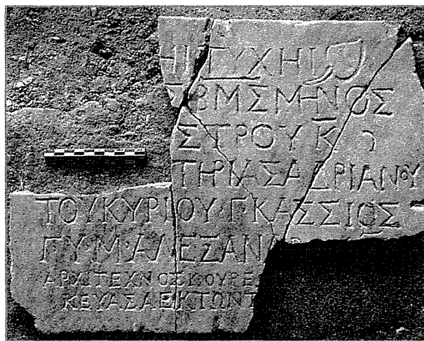
Fig. 4 - Association des barbiers.