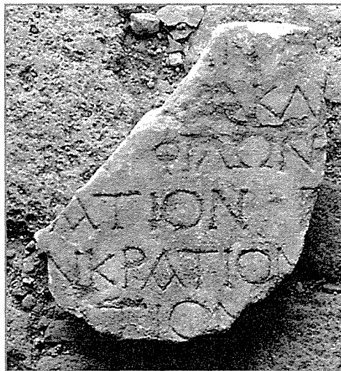
Fig. 7 - Fragment d'une seconde inscription agonistique.

L. 3: nom propre Φίλων? Le mot semble mis en valeur par l'espace laissé au début. L. 5 (et peut-être 4 et 6): [πα]γκράτιον «lutte»? Comme la précédente, il s'agit d'une liste de victoires à des concours.