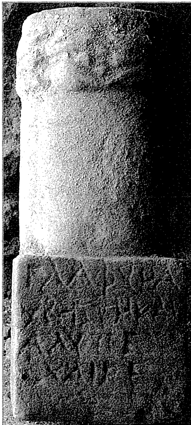
Fig. 1 - Cippe de Glaphyra.

« Glaphyra, bonne et qui n'a pas causé de peine, adieu ! »