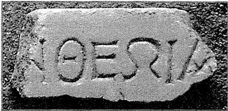
Fig. 10 - Fragment de dédicace à Asklépios.

Il y avait peut-être d'autres lignes ensuite. La copie Dunand indiquait que la première lettre était I, mais le nu est sûr. Restitution d'après GR6. Au début, [τὸν βώμο]ν, [τὸν οἶκο]ν, vel sim. ?