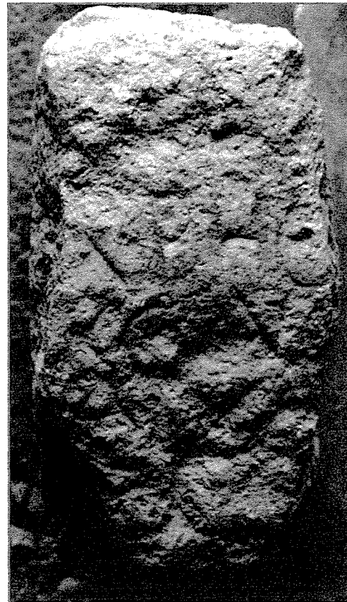
Fig. 2 - Restes d'une inscription funéraire.

2- Fragment de calcaire avec traces de rubrication. Surface très irrégulière. Incomplet de tous côtés (?). Restes de 4 lignes de grec. 15 x 7,5 x 13; h.l. 2,5 puis 2 cm. (Fig. 2).