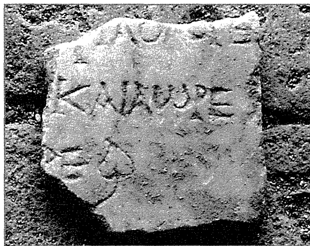
Fig. 3 - Restes d'une inscription funéraire.

Une feuille de lierre termine la l. 3. La haste isolée sous le niveau de la ligne 1 ressemble fortement au bas d'un phi . Φιλόλογε serait un adjectif décrivant le personnage dont c'est