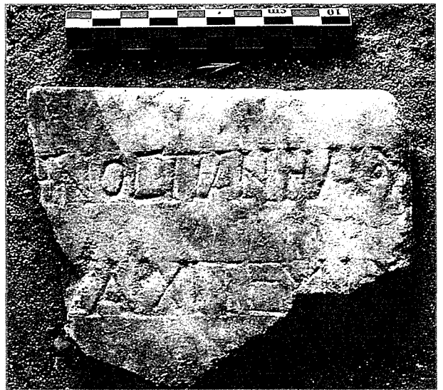
Fig. 5 - Inscription d'un architechnos (?).

Il pouvait y avoir une troisième ligne. L. 1: très petit o entre M et Υ; l. 2: on retrouve le mot au n o précédent.