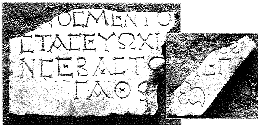
Fig. 9a et b - Deux fragments d'une inscription mentionnant les empereurs.

9- Coin inférieur gauche ( ? ) d'une plaque de marbre. Inv E1756 ( ? ). Une ligne fragmentaire puis début de 3 lignes de grec. 11,5 x 17 x 1,8; h.l. 2 cm. Second fragment (même numéro d'inv et même épaisseur): 10 x 5 x 1,7; h.l. 1,7. Traces de rubrication dans les lettres (Fig. 9).