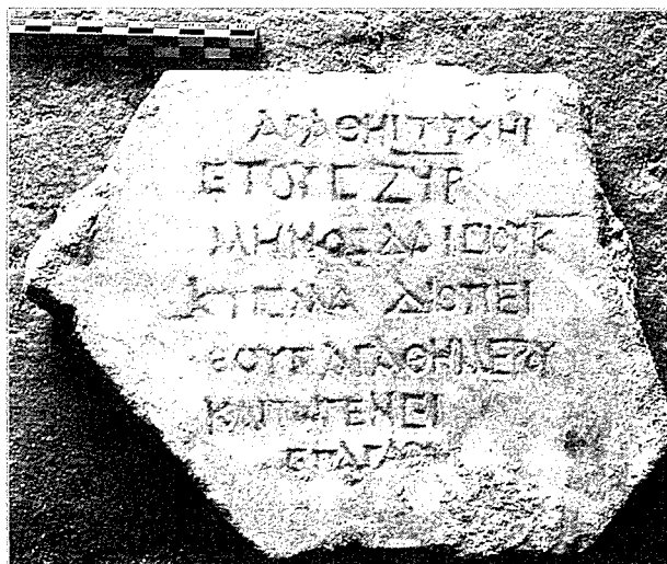
Fig. 8 - Dédicace d'une construction.

formules semblables ailleurs Hesperia 3, p. 112, n° 176 (ἐπ' ἀγαθῶ τῆς οἰκίας). L'exclamation est particulièrement fréquente dans l'épigraphie égyptienne (Bernard 1975-1981, passim ). Voir le suivant.