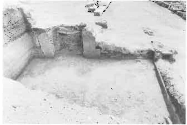
Fig. 41 - Palais du Stratège. Maison au pied du palais. Pièce 33 en cours de fouille. À gauche, le mur est un front de taille d'une carrière dans laquelle s'est installée la maison. Au centre, la porte de la pièce dont le linteau est en partie effondré. Noter le type de construction du montant de droite, en escalier, afin d'assurer un bon accrochage avec les briques crues qui constituent l'élévation du mur. À droite, on peut voir le sommet de l'arase de blocage du mur nord ; l'élévation de briques a presque entièrement disparu. À l'arrière, la prolongation des murs de la maison apparaît en surface. Vue vers l'ouest.

L'intérieur de la pièce était rempli de terre grise issue de la décomposition de la brique. On a découvert, tombée de champ sur un sol de même nature, une partie du mur ouest, ce qui prouve qu'une importante dégradation des différents éléments de la construction a précédé la chute du mur. Ces éléments sont à mettre en rapport avec l'existence de trous de boulins dans le mur sud, situés plus haut que le linteau de la porte, et avec la découverte dans le prolongement de ces mêmes trous, au centre de la pièce, de traces de bois brûlé qu'il est tentant d'identifier avec des poutres soutenant, soit le toit, soit un étage. Les trous de boulins, situés à plus de 1 m en dessous du sommet de la partie conservée du mur sud, incitent à préférer la deuxième solution. Beaucoup de céramique mêlée à des fragments de verre a été découverte dans cette pièce, en particulier une jarre presque complète et un fragment de jarre portant l'inscription MAΞΙΜΟΣ (fig. 42). Cet élément est en concordance avec ce que l'on sait de la date tardive de ces installations au pied du palais. L'abondance de la céramique concorde avec une interprétation qui ferait de ces pièces un