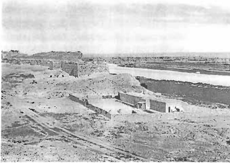
Fig. 1 - La maison de fouille construite par M. Pillet, vue vers le nord. Cliché 1929 ou 1930. L'îlot B2 et la citadelle n'ont pas encore été fouillés. Remarquer les Decauville dans la cour de la maison et les tentes des soldats devant l'entrée de la citadelle. (Arch. Yale Univ. Art Gall.).

toujours d'accord pour la division de la synagogue, et que « Seyrig says that they are just making a new law for Syrian antiquities, that the excavations should divide their finds into two halves and the state take their choice of which one it wishes ».