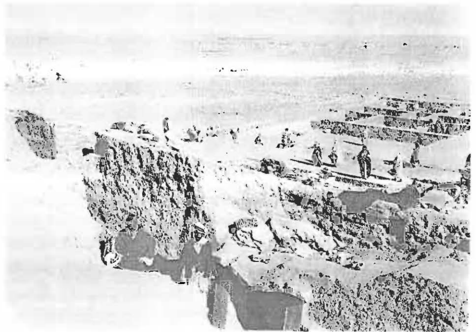
Fig. 3 - Fouille de l'îlot M7 le long de la rue principale et dégagement de la rue du rempart. Vue vers le nord. (Arch. Yale Univ. Art Gall.).

À la lecture des chiffres, on est moins étonné de l'énormité des travaux de dégagements entrepris et réalisés (fig. 3). On a vu que la surveillance des travaux était lointaine, ce qui s'explique si l'on compare le nombre d'ouvriers (plus de 300) et ceux des contremaîtres (5) et des archéologues (3) en 1931-1932. Les ouvriers ne sont pas nombreux au début des missions et ceci ne vient pas seulement du désir de commencer progressivement. Comme l'explique Hopkins dans Discovery (p. 48), les semi-nomades employés sur le chantier ne restent que pendant l'hiver sur les bords de l'Euphrate et sont