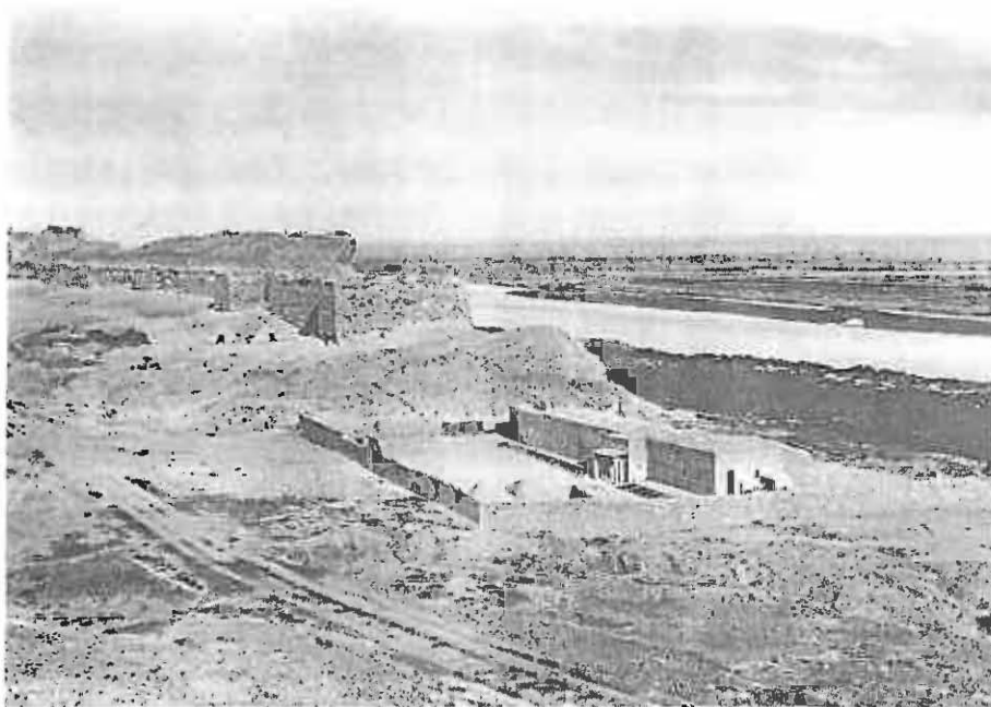
Fig. 1 - La maison de fouille construite par M. Pillet, vue vers le nord. Cliché 1929 ou 1930. L'îlot B2 et la citadelle n'ont pas encore été fouillés. Remarquer les Decauville dans la cour de la maison et les tentes des soldats devant l'entrée de la citadelle. (Arch. Yale Univ. Art Gall.).

toujours d'accord pour la division de la synagogue, et que « Seyrig says that they are just making a new law for Syrian antiquities, that the excavations should divide their finds into two halves and the state take their choice of which one it wishes ».