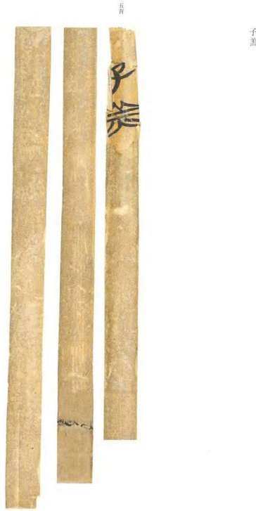
Fig. 2 | Titre inscrit au dos de la cinquième latte du manuscrit Zigao , reproduit dans Shanghai bowuguan cang Zhanguo Chu zhushu (er) 上海博物館藏戰國楚竹書(貳), Ma Chengyuan 馬承源 (dir.), Shanghai, Shanghai guji chubanshe, 2002, p. 38.

La structure générale et le contenu du texte suggèrent qu'il s'agit d'un dialogue fictif, probablement composé après la mort de Zigao ; les estimations des spécialistes oscillent entre la seconde moitié du v e et le iv e siècle 4 . Sur le plan du contenu, le Zigao se présente