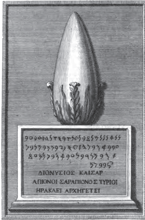
Fig. 2. Un des deux cippes de Malte (gravure de l' editio princeps de 1735).

Il s'agit d'une dédicace à « notre seigneur Milqart, maître de Tyr » ( l'dnn lmlqrt b'l šr ), « Héraclès archégète » (Ἡρακλεῖ ἀρχηγέτει), par deux frères, (85-86) Διονύσιος καὶ Σαραπίων οἱ Σαραπίωνος Τύριοι, Dionysios et Sarapiôn, fils de Sarapiôn, 'bd'sr w'hy 'sršmr šn bn 'sršmr bn 'bd'sr , 'Abd'osir et son frère 'Osirshamar, les deux fils de 'Osirshamar fils de 'Abd'osir : CIS , I, 222 et 222a, et, pour le grec, IG , XIV, 600 68 .