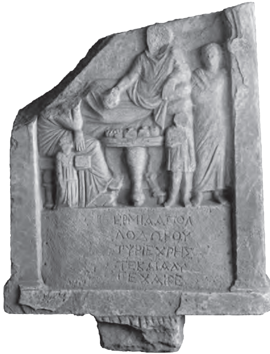
Fig. 1. Rhénée : épitaphe d'Hermias fils d'Apollodôros.

Outre l'épitaphe de deux frères peut-être tyriens citée supra , M.-Th. Le Dinahet-Couilloud, « Une famille de notables tyriens à Délos », BCH , 121, 1997, p. 632 et 638, publie également deux inscriptions qui concernent la même femme,