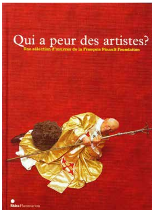
Fig. 7. Couverture de Qui a peur des artistes ? Une sélection d'œuvres de la François Pinault Foundation , cat. expo. (Dinard, Palais des Arts, 14 juin – 13 septembre 2009 ; commissariat : Caroline Bourgeois), Paris, Skira, 2009. Œuvre représentée : Maurizio Cattelan, La nona ora , 1999, cire, peinture, tissu et mannequin en fibre de verre grandeur nature, Collection Pinault.

Il ne s'agit plus seulement d'avoir une collection majeure, ni même de compétition entre collectionneurs de premier plan, dont chacun aura désormais son musée ou sa fondation. Il s'agit de donner le ton, de lancer les tendances et, à terme, de supplanter