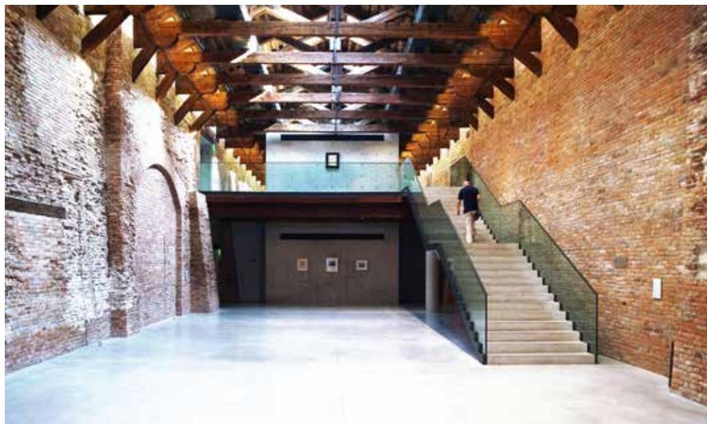
Fig. 5. La Collection Pinault à la Pointe de la Douane, Venise, 2019.

Mais en 2006, lorsqu'est présentée pour la première fois au public sa collection, François Pinault donne à voir une figure complète de collectionneur, « moderne » aussi bien que « contemporain 19 ». Le titre de l'exposition inaugurale, Where Are We Going? , évoque aussi bien Paul Gauguin 20 qu'une œuvre de Damien Hirst dans la collection. Les œuvres « modernes », qui sont en fait dans cette exposition les œuvres à l'esthétique la plus épurée – peinture abstraite des années 1950, sculpture minimale des années 1960 et arte povera italien 21 –, ont une fonction de légitimation symbolique. Le commissariat de cette exposition était confié à Alison M. Gingeras, qui a été conservatrice au Centre Pompidou et qui fut débauchée du Solomon R. Guggenheim Museum pour l'occasion, devenant alors curator de la Collection Pinault à Venise.