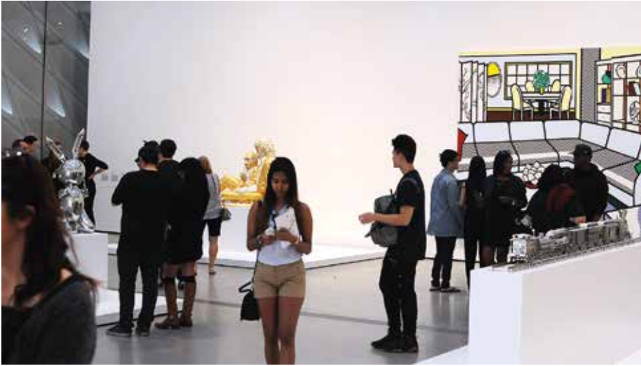
Fig. 3. Vue de l'exposition inaugurale de The Broad, Los Angeles, mars 2016. À gauche, Rabbit de Jeff Koons.