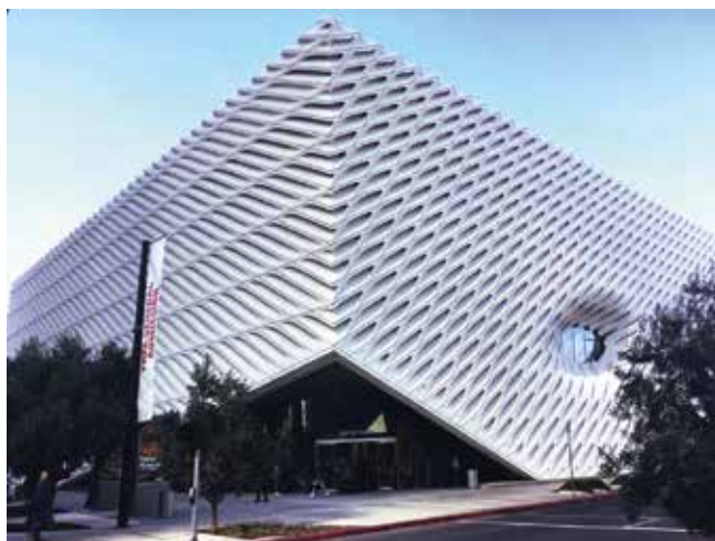
Fig. 1. Los Angeles, The Broad, architectes : Diller Scofidio + Renfro, 2015.

Le paysage muséal des deux dernières décennies a été profondément recomposé par le développement des musées privés. Leur nombre a considérablement augmenté et, pour les plus importants d'entre eux, leur puissance symbolique rivalise avec celle des musées nationaux d'art moderne et contemporain à vocation encyclopédique – influence sur les cotes et les carrières d'artistes, production de discours de légitimité valant pour écriture de l'histoire de l'art. Conçus par des architectes parmi les plus en vue, le cabinet Diller Scofidio + Renfro et Tadao Ando, les musées privés d'Elie et Edythe Broad à Los Angeles ( fig. 1 ) et de François Pinault à Venise et bientôt à Paris se rapprochent par le nombre, la qualité et parfois la célébrité de leurs œuvres des plus grands musées d'art moderne et contemporain, comme le Centre Pompidou à Paris, le Museum of Modern Art (MoMA) à New York ou la Tate Modern à Londres. De même que ces derniers produisent un récit et participent, par leurs acquisitions, l'accrochage de leurs collections et les expositions temporaires, à la production du canon moderne et à l'écriture