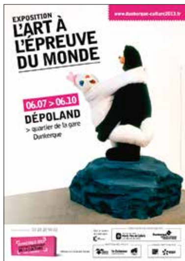
Fig. 6. Affiche de l'exposition L'art à l'épreuve du monde , Dunkerque, Dépoland, 6 juillet – 6 octobre 2013 (commissariat : Jean-Jacques Aillagon). Œuvre représentée : Paul McCarthy, Bear and Rabbit on a Rock , 1993, matériaux mixtes, 270 × 190 × 130 cm, Collection Pinault.

moderne et contemporain. Mais Jeff Koons, Takashi Murakami, Maurizio Cattelan (1960), Damien Hirst, Raymond Pettibon (1967) ou Paul McCarthy (1945) sont des choix qui passent encore pour secondaires, voire subsidiaires dans la presse généraliste, où l'accent est encore mis sur la contemplation et l'épure : le kitsch ou le grotesque ne sont que des découvertes que l'on s'autorise et qui font presque figure d'écarts. Sans que la chose soit ouvertement formulée, un canon classique et une norme esthétique sont réaffirmés : le silence et le dépouillement, la contemplation et la mystique, le refuge hors du monde.