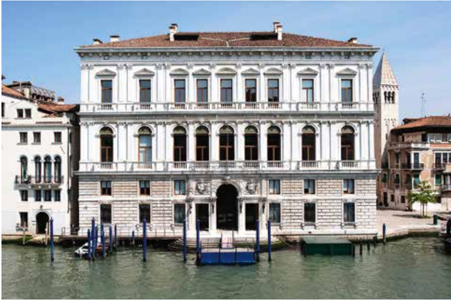
Fig. 4. Venise, Palazzo Grassi, années 2010.