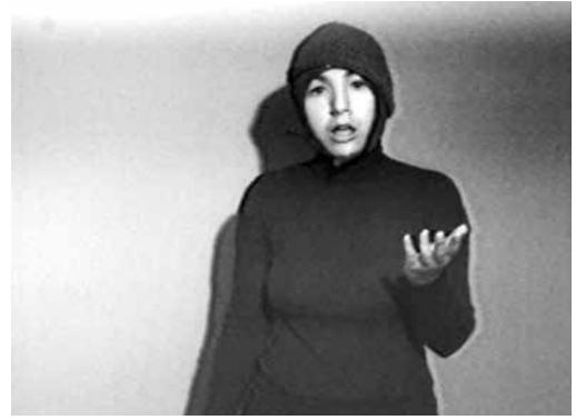
Fig. 7 et 8. Susan Mogul, Big Tip, Back Up, Shut Out , 1976, vidéo noir et blanc, son, 10 min. et 19 s., photogrammes.

– que possédaient les parents de l'artiste. Sa pratique évoluera de vidéos comiques empruntant des routines de stand-up à de véritables spectacles. En 1979, Mogul performe pour la première fois devant un public, à l'University of San Diego, où elle a repris des études 50 . Pendant les années 1980, elle continue la performance en parallèle à sa pratique vidéo. En 1987, News From Home consiste en un véritable spectacle de trente-huit minutes, typique des pratiques de crossover que Mogul ne récuse pas. Une décennie après ses vidéo-performances, Mogul peut ainsi présenter des sketches ou spectacles comiques, témoignant d'une relation décomplexée au divertissement. En cela, les expériences des années 1970 sont séminales et méritent une attention particulière : avant d'assumer le divertissement, les œuvres de l'époque l'interrogent. Big Tip, Back Up, Shut Out , en particulier, questionne son propre statut d'œuvre hybride, son potentiel de divertissement, son possible devenir-sketch.