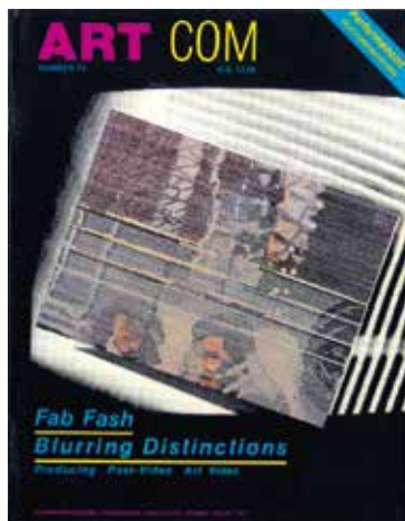
Fig. 3. Art Com , 19, 1982, couverture.