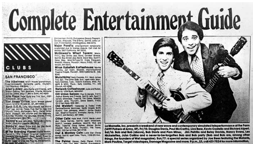
Fig. 6. Bob & Bob dans la rubrique « Complete Entertainment Guide », The Bay Guardian Day and Night , 14 février 1980, p. 13.

Bob & Bob délaissent le modèle du comédien de stand-up, qui inspirait en 1975 leurs premières performances dans la classe de l'artiste Llyn Foulkes au Otis College of Arts de Los Angeles, pour développer une figure d'artiste-entertainer inclassable. Dans cette histoire du brouillage des frontières et du franchissement des limites, ils sont à la fois des précurseurs et un apex. La dissolution du duo en 1984, un an après avoir sorti un album chez Polydor Records ( We Know You're Alone ) est à cet égard un événement significatif : Bob & Bob affirment avoir cessé leur pratique au moment où ils devenaient mainstream , c'est-à-dire au moment où les concessions nécessaires pour intégrer les circuits de l'industrie du divertissement avaient entamé leurs engagements. Tout l'intérêt de leur pratique dans la deuxième moitié des années 1970 tenait à son ambiguïté foncière : être une parodie de parodie, insaisissable, se faire le miroir des désirs communs, de leur simplicité, de leur banalité, mais aussi de leur bêtise. Une fois