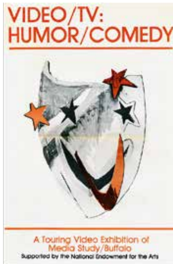
Fig. 4. John Minkowsky (dir.), Video/TV: Humor/Comedy , Buffalo, Media Studies Center, 1982, p. 1.

qu'elle cherchait à produire, ce qui l'a conduite à cesser ce type d'intervention : « Je ne suis pas une entertainer , je ne suis pas une humoriste, et cela ne m'a jamais intéressée 38 . »