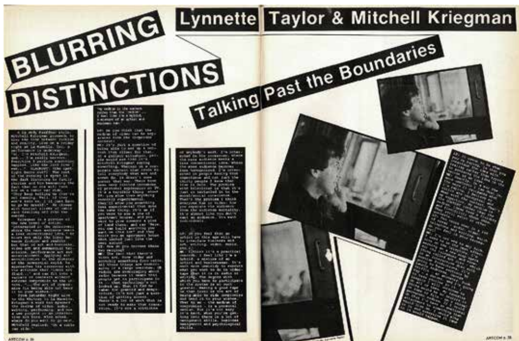
Fig. 2. Lynnette Taylor et Mitchell Kriegman, « Blurring Distinctions: Talking Past the Boundaries », Art Com , 19, 1982, p. 34-35.

Les récents travaux portant sur l’art californien autour de 1970 ont surtout insisté sur l’activisme politique et social des artistes ; ils n’évoquent qu’à la marge l’importance de Hollywood et l’industrie du divertissement 17 . Le modèle étudié ici n’est pas celui du théâtre d’avant-garde, que Claire Bishop propose de penser comme séminal pour l’art du xx e siècle 18 , mais celui de l’ entertainer , de l’humoriste ou encore de la comédienne ou du comédien de stand-up. Cet article et les recherches postdoctorales dont il résulte cherchent à constituer l’une des toutes premières tentatives pour cerner le rôle d’un autre aspect de la culture populaire : le divertissement comique à l’heure des médias de masse et le développement de ce que j’appellerai le modèle de la comédie de stand-up , à savoir non pas l’influence d’images ou de contenus, mais le développement d’un nouveau positionnement d’artiste.