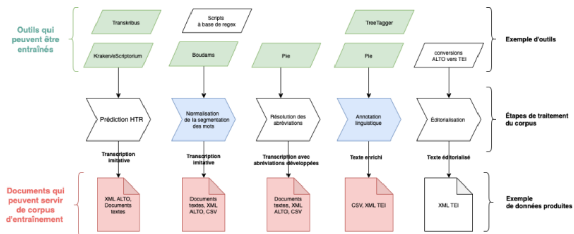
Figure 2 : Exemple de protocole, issu de Ariane Pinche, « Guide de transcription pour les manuscrits du X e au XV e siècle », 2022